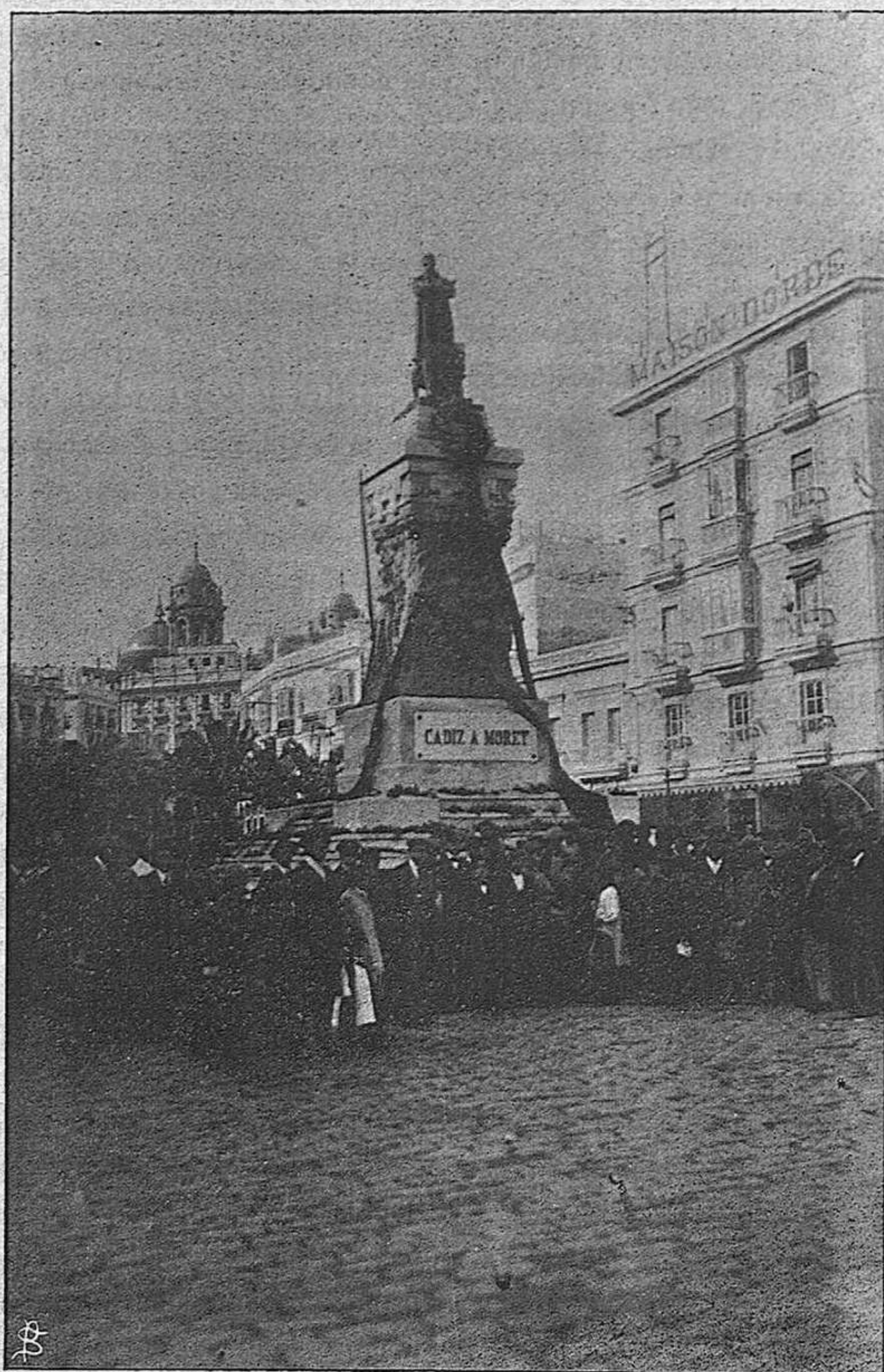
CÁDIZ.—Estatua de D. Segismundo Moret, elevada por suscripción pública.