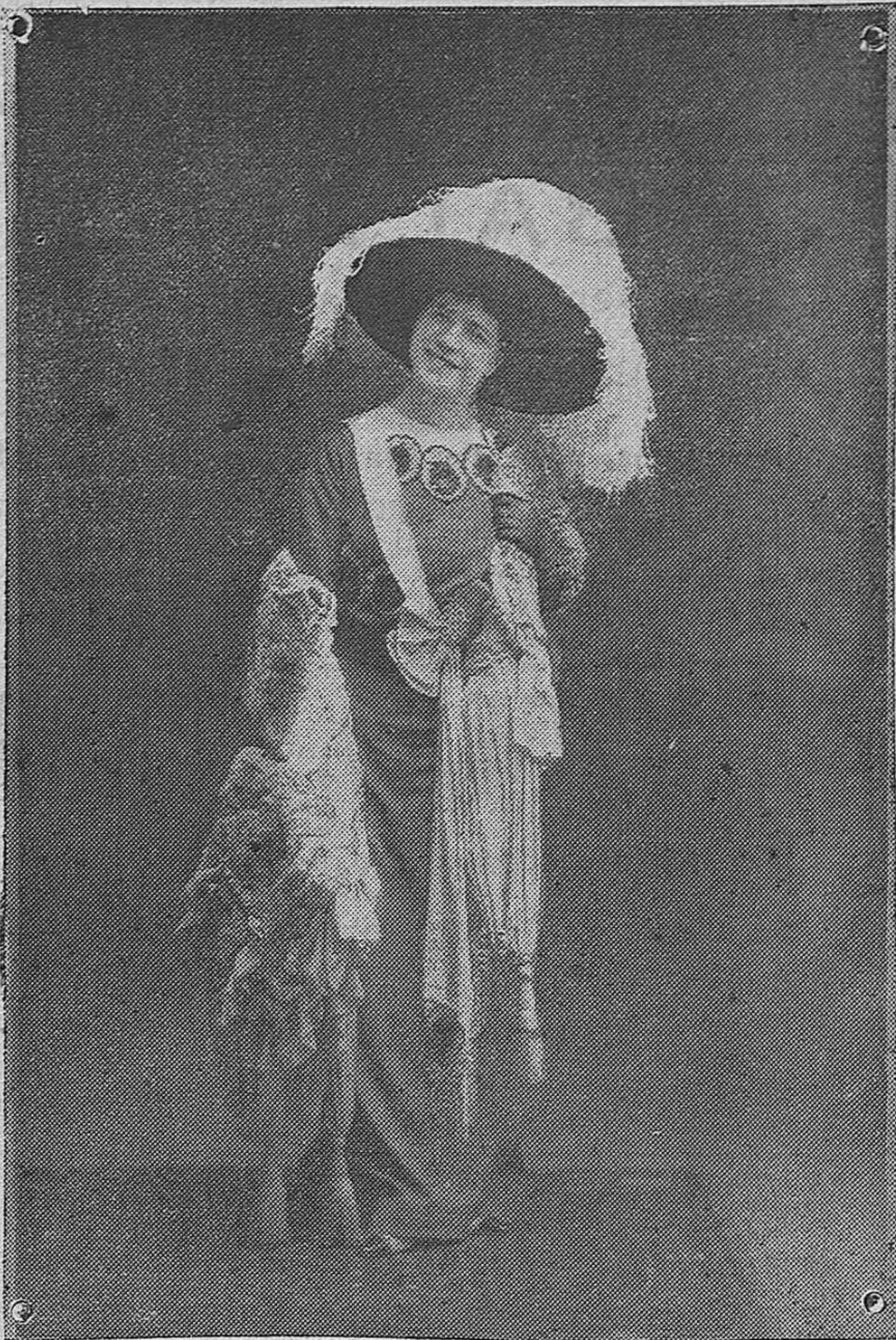
La notable trágica italiana Mimí Aguglia, que ha debutado en el Gran Teatro.

Esta publicación—la más económica entre todas las que aparecen en Cádiz—distribuye todos los meses entre sus anunciantes y suscriptores, en combinación con la Lotería Nacional, varios regalos consistentes en décimos de lotería, vales que dan opción á fotografiarse en la acreditada casa del Sr. Cepillo, libros diversos, etc., etc.