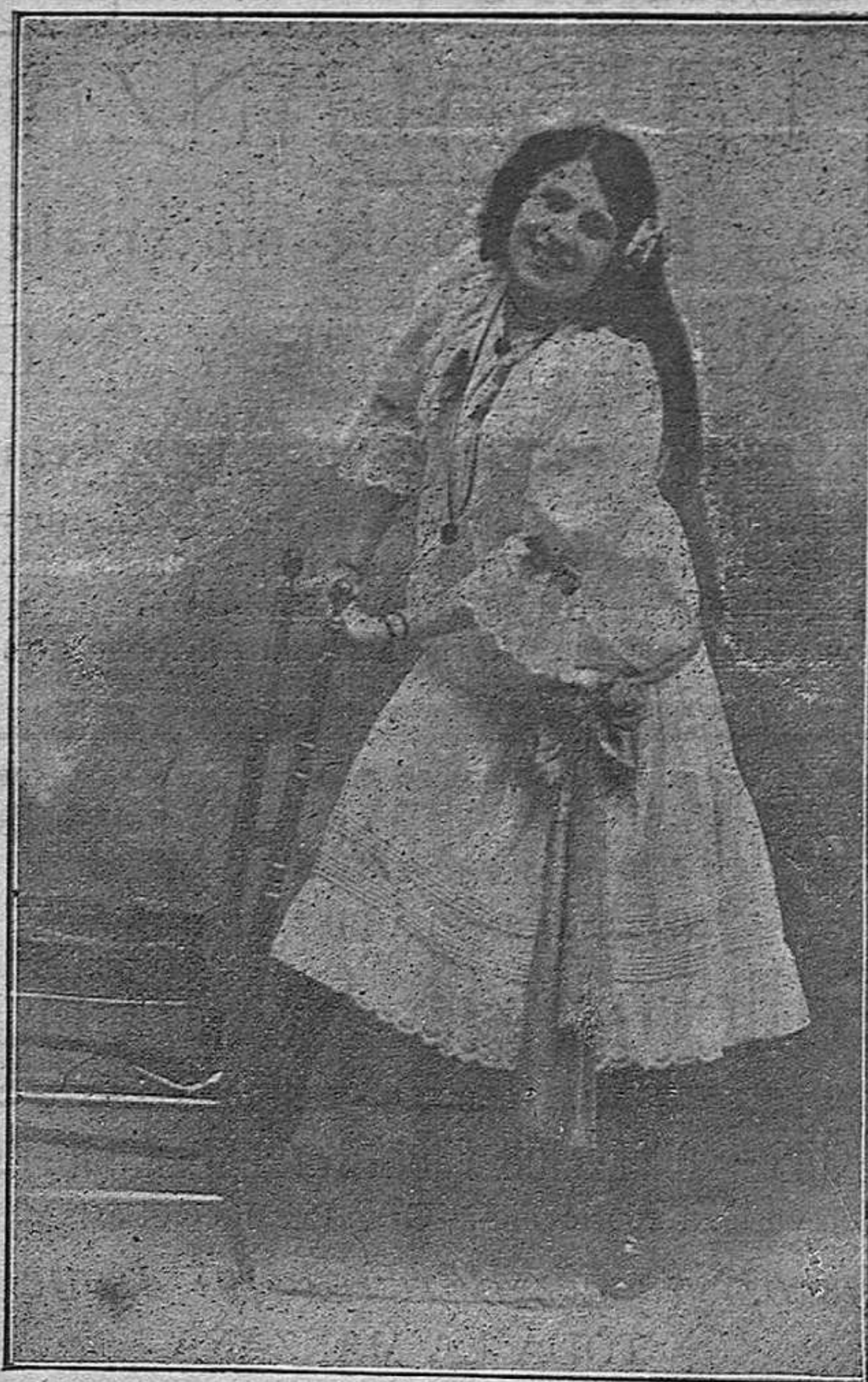
La aplaudida tiple cómica Julita Mesa en la zarzuela "Moros y cristianos".