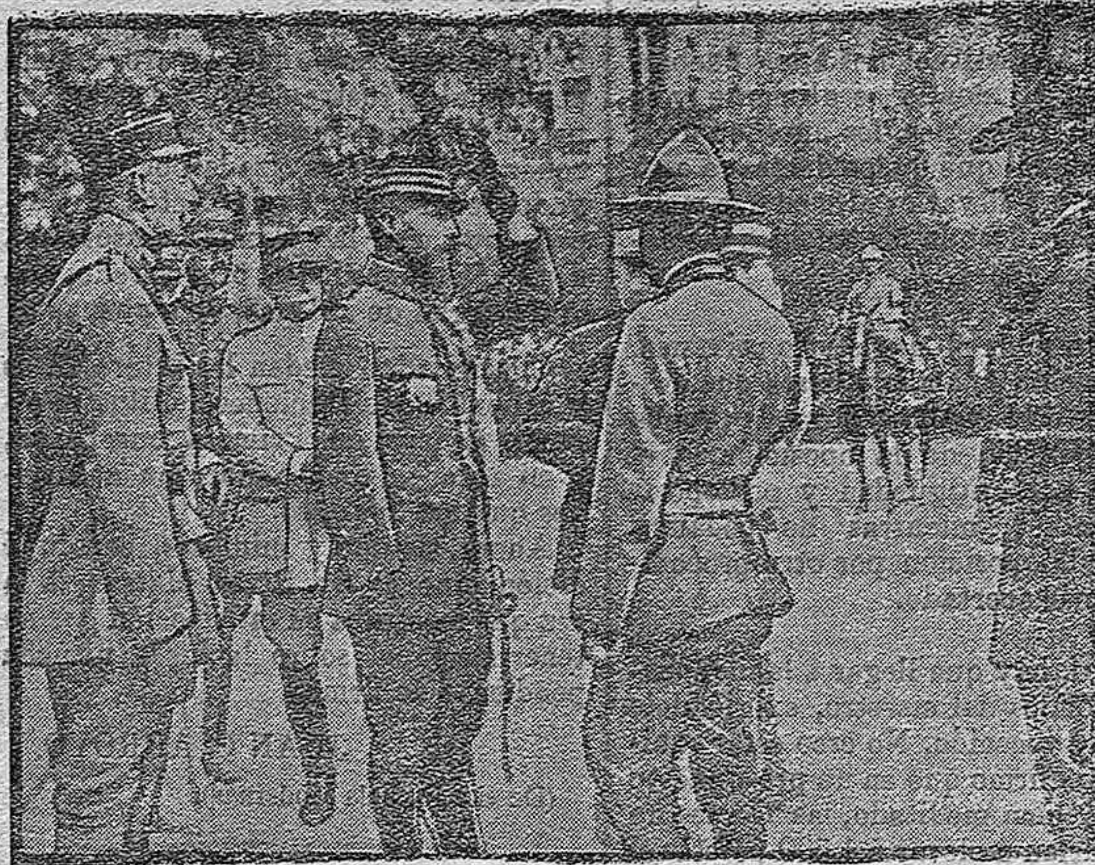
El general Gouraud revistando las tropas americanas.

En cuanto a las consecuencias morales de una paz separada rusa, éstas le parecen al «Daily News» como las más aplastantes para los aliados, porque, según su opinión, era precisamente la revolución rusa; es decir, la anulación del zarismo militarista y despótico, el único hecho glorioso que los aliados se podían apuntar en esta guerra.