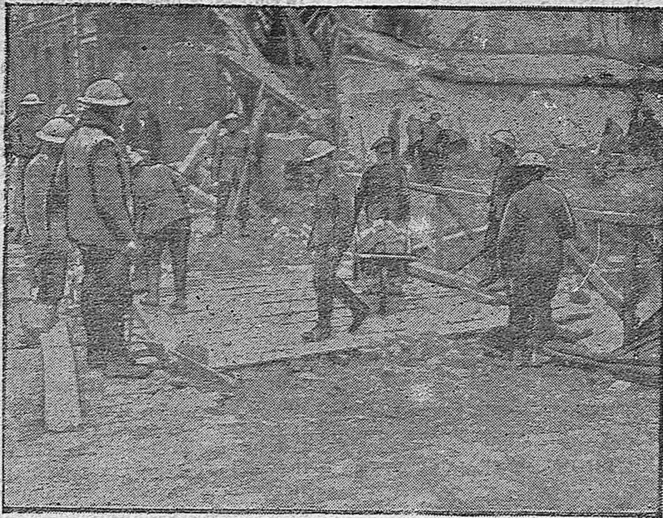
Soldados arreglando los caminos destruidos por los alemanes.