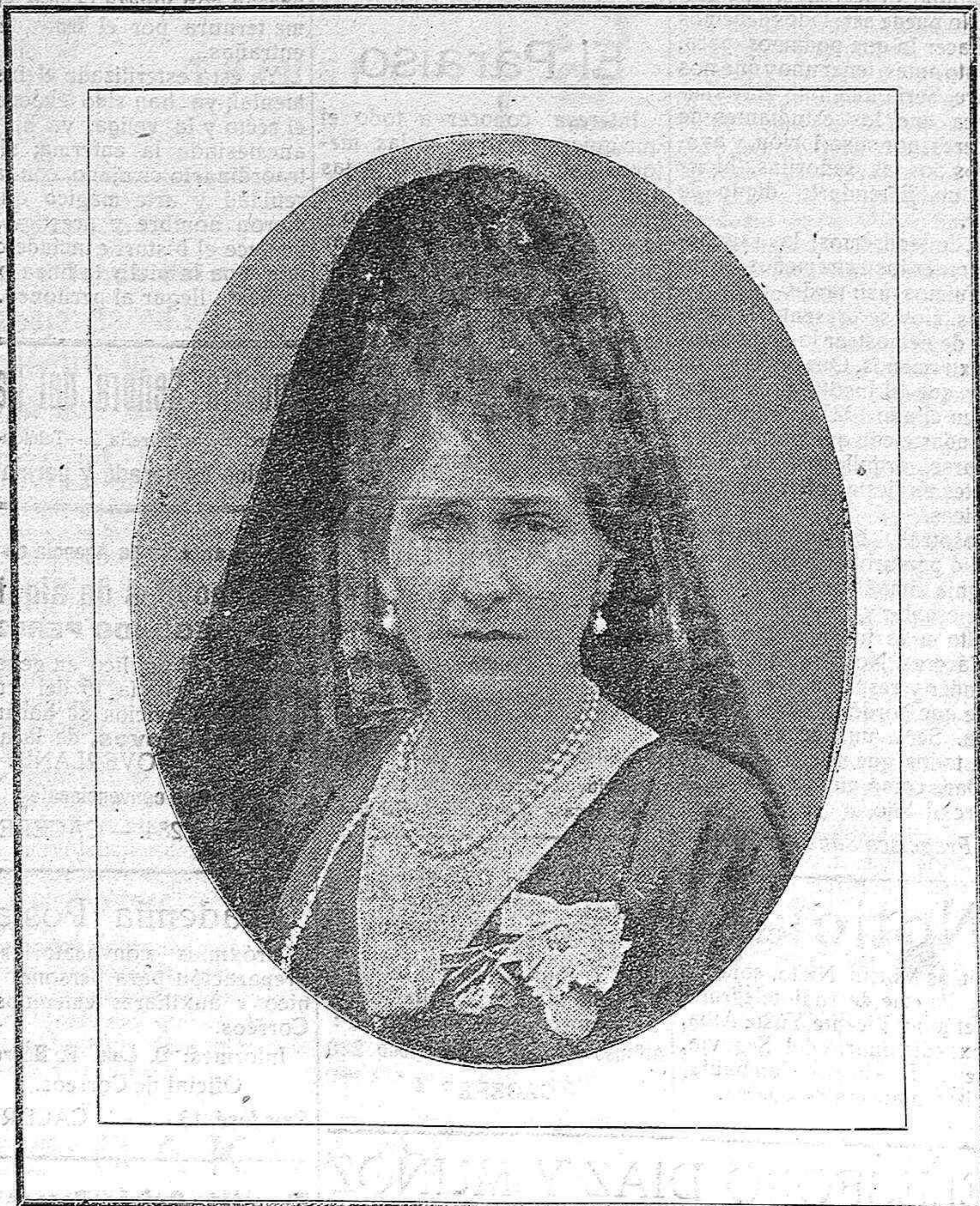
LA AUGUSTA SOBERANA DE ESPAÑA D a VICTORIA EUGENIA Alcaldesa honoraria de todos los Ayuntamientos de España