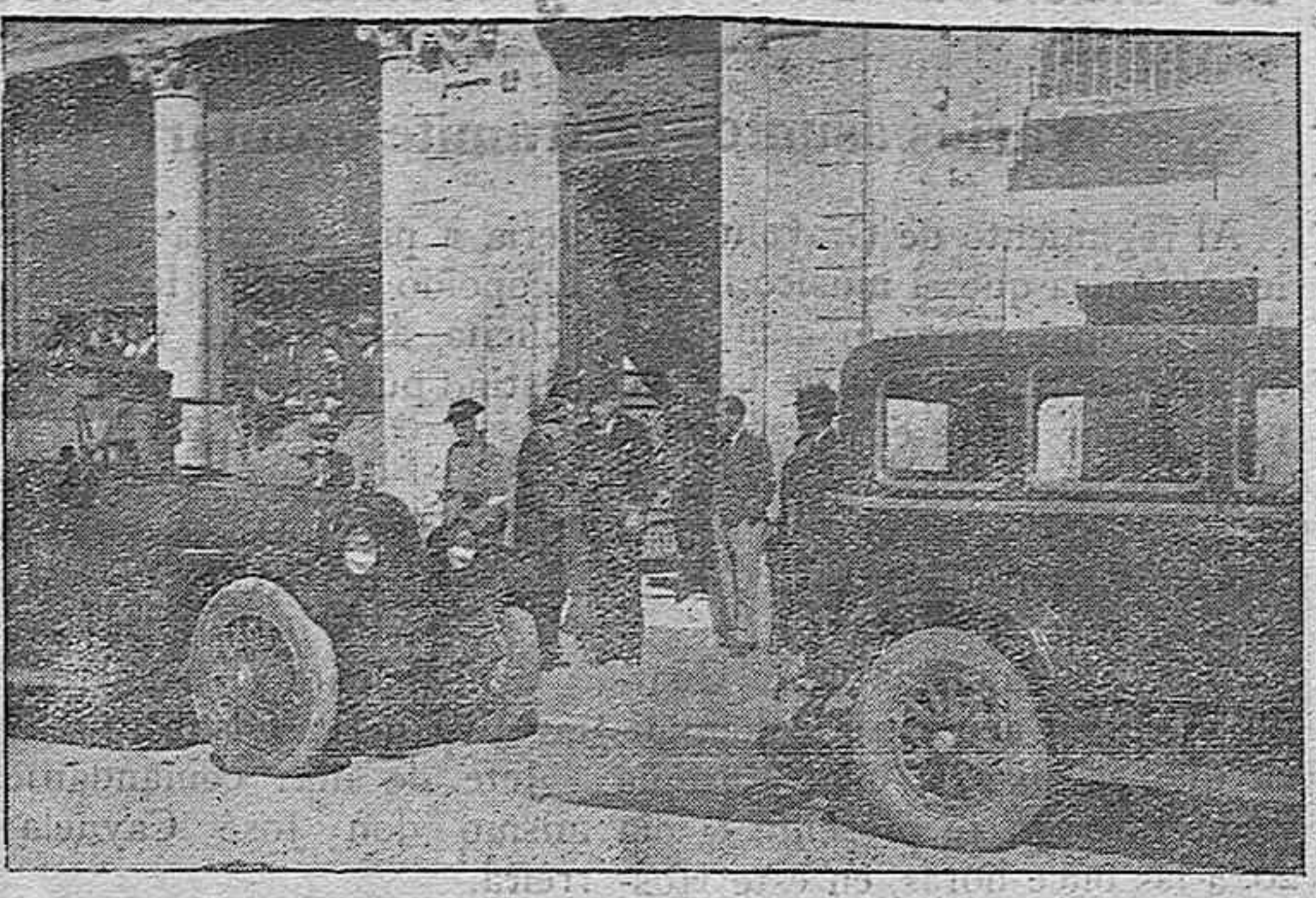
ALMENDRALEJO. —El gobernador, señor conde de Salvatierra, y el alcalde de Almendralejo, conversan en la puerta del Hotel España, momentos antes de salir su majestad la Reina de Rumania con dirección a Mérida

Madrid.—La "Gaceta" dispone que los auxiliares oficiales cuartos a extinguir en el Cuerpo de Hacienda, pasen a la escala técnica con la antigüedad de primero de marzo, si en esa fecha continuaban prestando sus servicios en aquella categoría. También dispone la "Gaceta" que la regulación de los contratos de trabajo pasen a la Sección de reglamentación del trabajo.