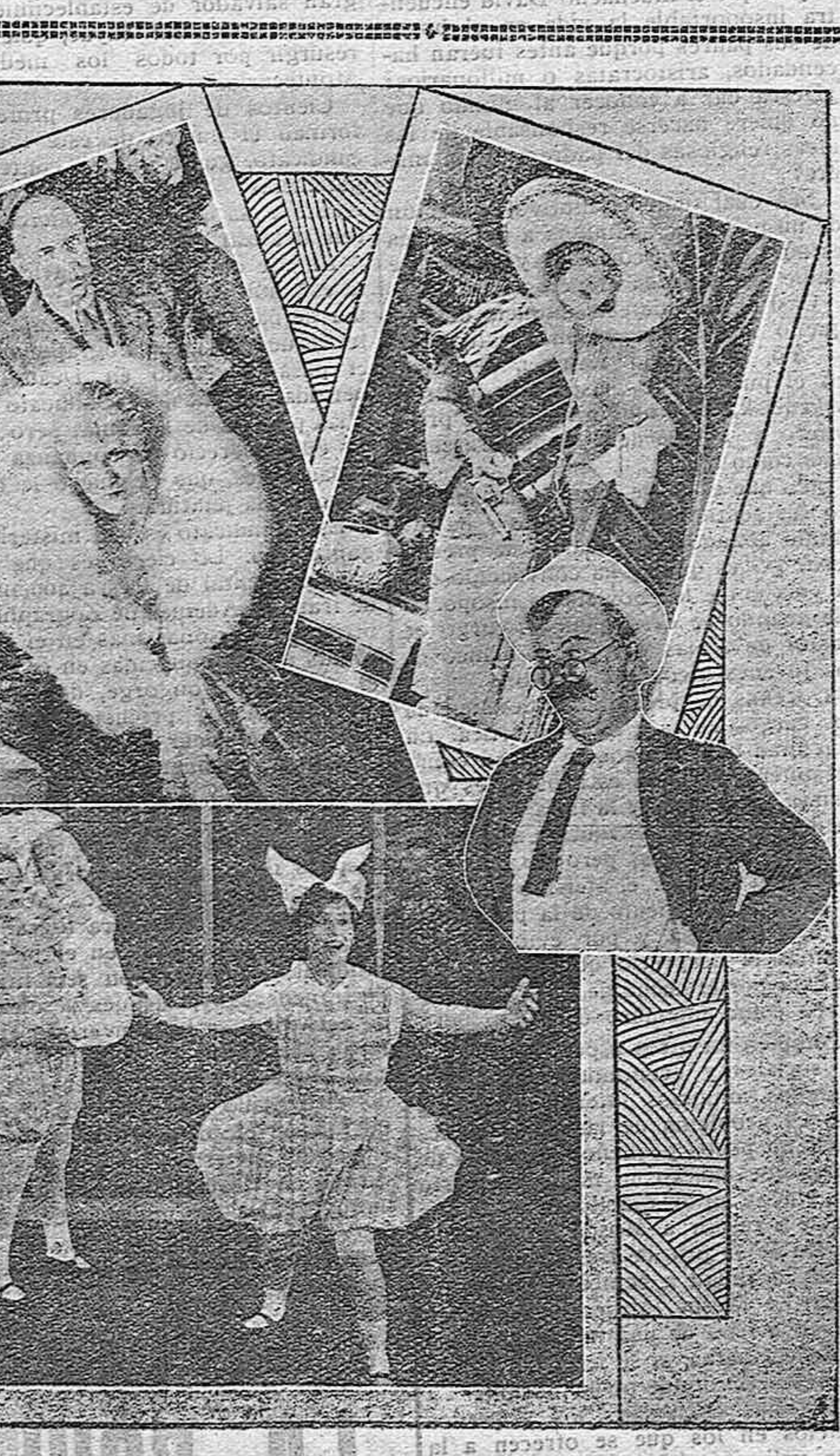
Brindamos a nuestras gentiles lectoras y a nuestros inteligentes cineastas un sugestivo manojito de fotos.

El tío del Xilofone declara que es un haragán formidable y que, por otra parte, hace en esta Sección lo que le da la gana, así... Y si el director de la plana de cine quiere algo con él, lo espera ahí, fuera de puertas... no se vaya a creer que porque es viejo... Adén más un hombre de los de la nueva era y exigirá responsabilidades; si, señor, el tío del Xilofone está enfadado hoy, muy enfadado; y con razón. Aunque es muy difícil que pierda el humor, hoy no está para hacer articular los jocosos. Resulta que pensaba vestirse de máscara mañana para hacer la Piñata, danzando por esas calles, enarandadas por cierto como si se preparara una carga. Con este objeto en-