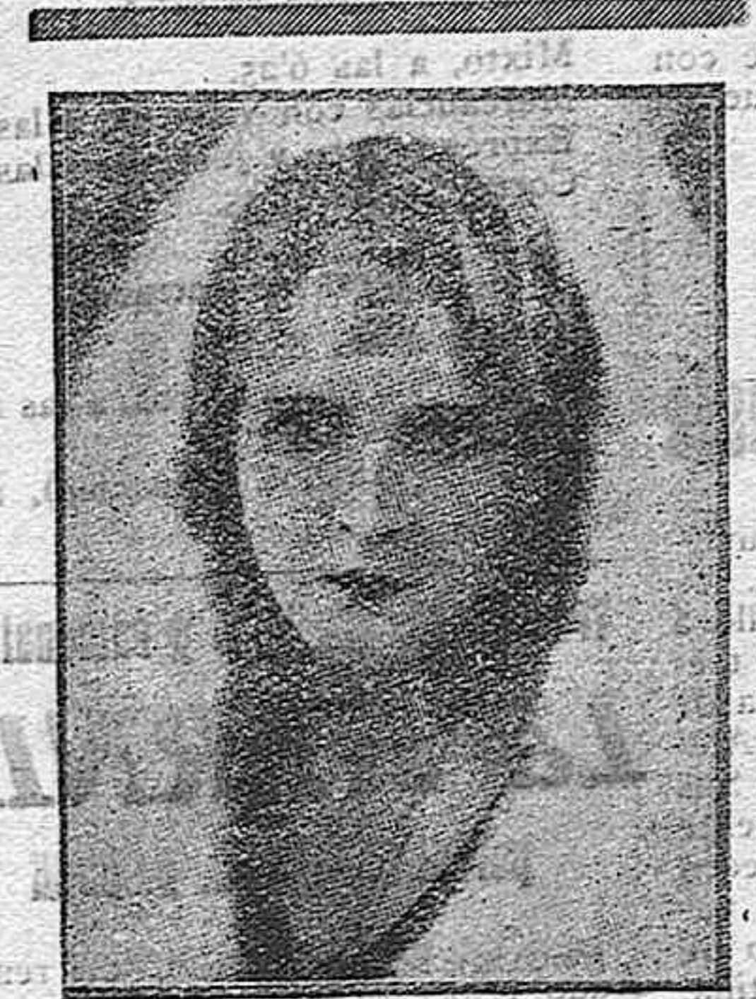
Lillian Gish, la espiritual star de la Paramount