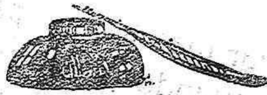
Para reparación de motores de aceites pesados y maquinaria en general. "LEGIDO"