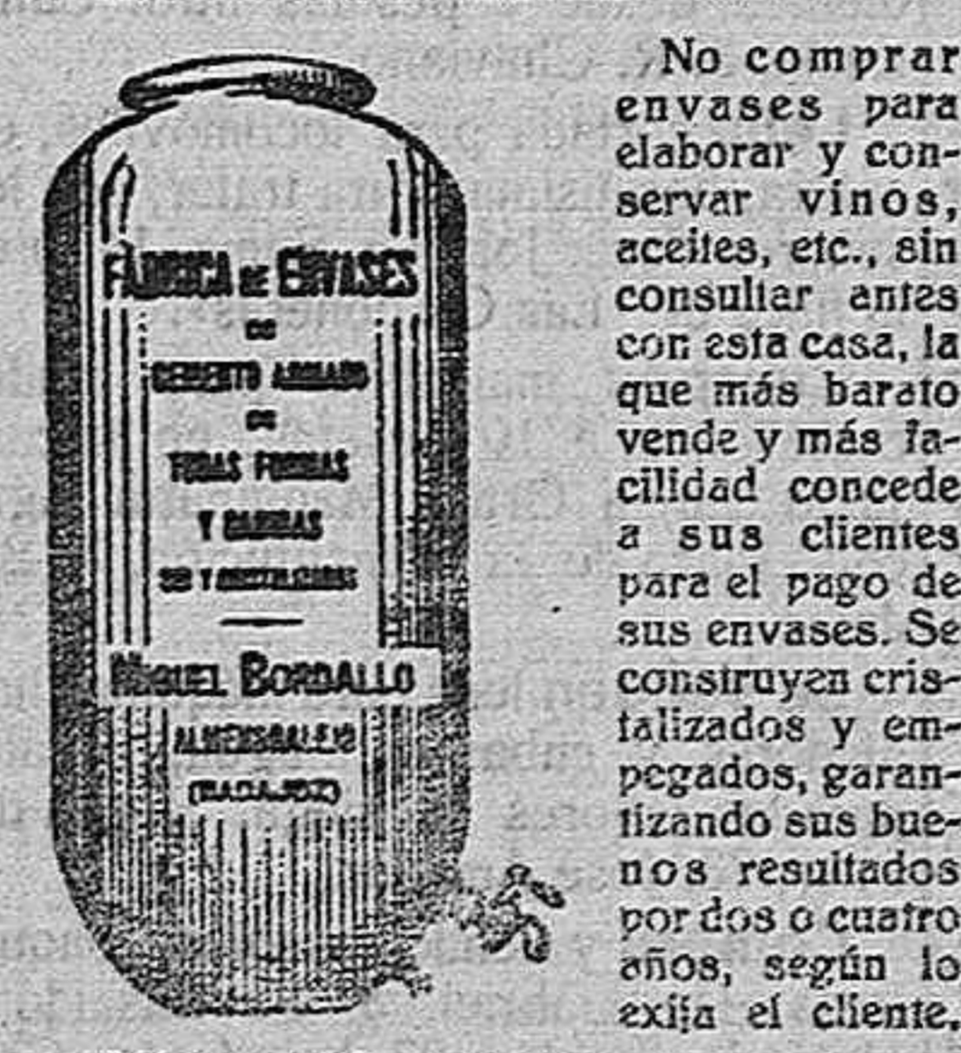
FABRICA DE FIBRAS DE CEMENTO ARMADO MIGUEL BORDALLO ALMENDRALEJO