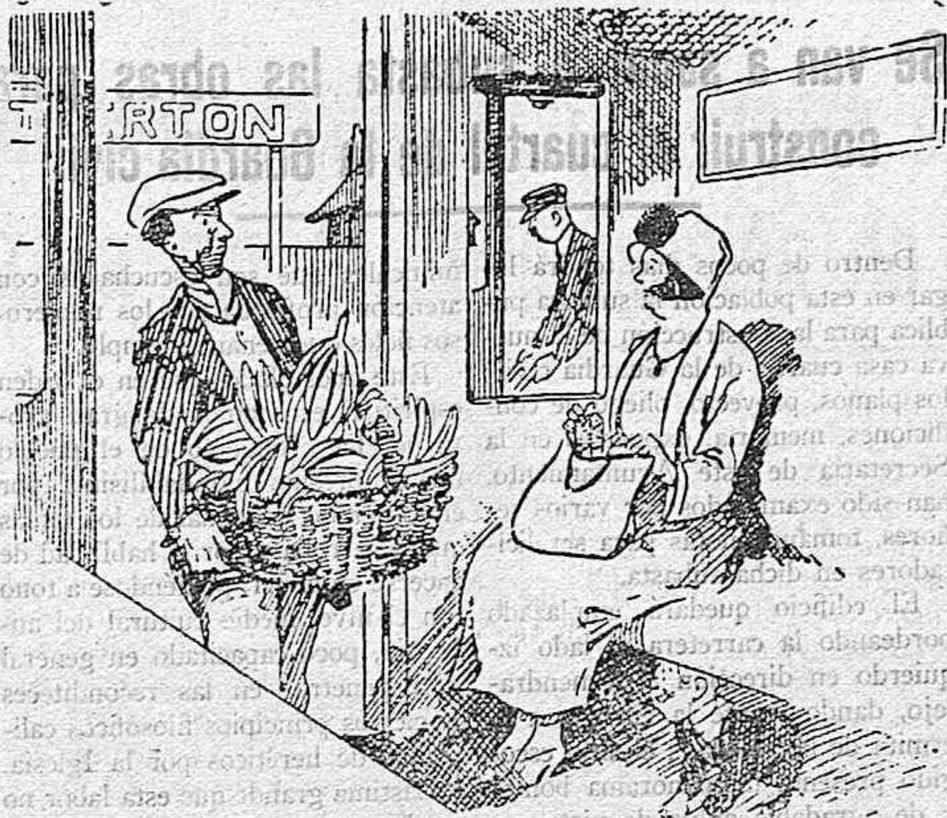
El vendedor de plátanos.—Señora, ¿puedo colocar esta cesta debajo de su asiento? La señora (que ha colocado allí a su hijo, por economía).—Puede usted, pero no se lo aconsejo...