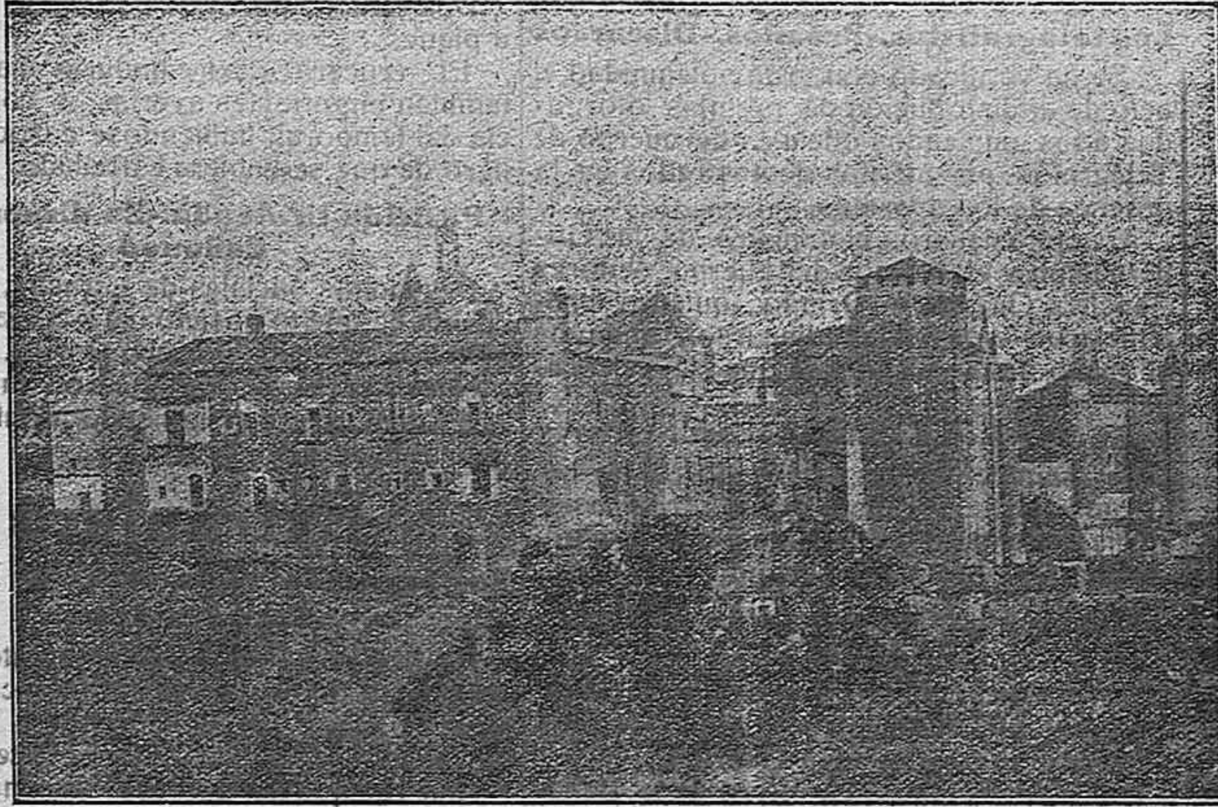
Vista exterior del histórico monasterio de Guadalupe