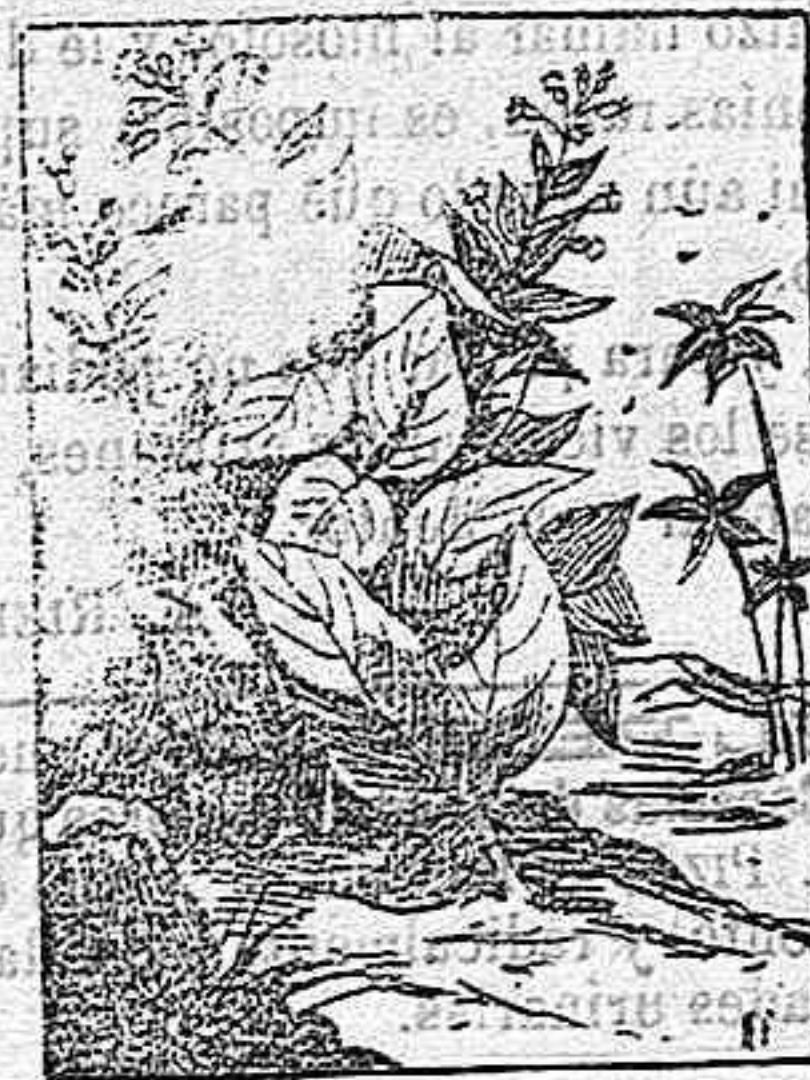
TABACO (Nicotiana tabacum)

Esta planta es originaria de América. La historia de la introducción del tabaco en Europa solamente, ocuparía un libro. Nosotros solo disponemos de un corto espacio, y por ello tratamos tal asunto a la ligera.