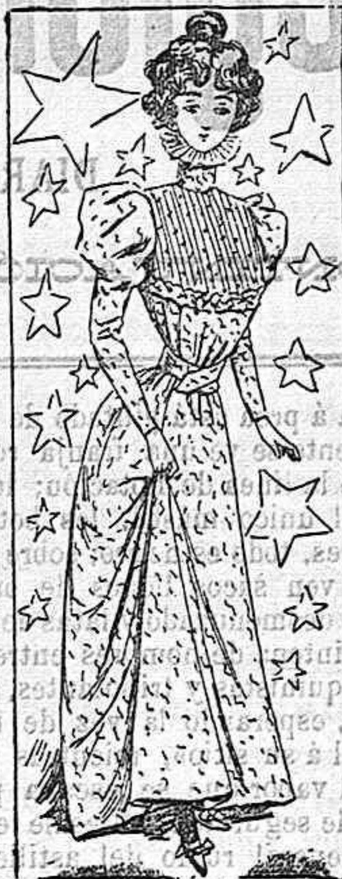
Bata para entretiempo.

Modelos exclusivos para nuestras lectoras, de los grandes almacenes de EL SIGLO, Barcelona (I).