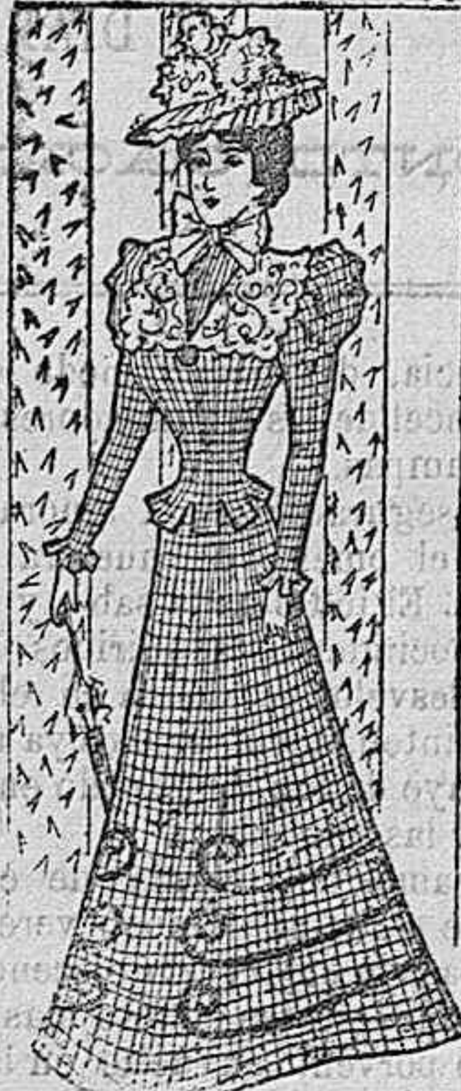
Traje para paseo.

Modelos exclusivos para nuestras lectoras, de los grandes almacenes de EL SIGLO, Barcelona (1).