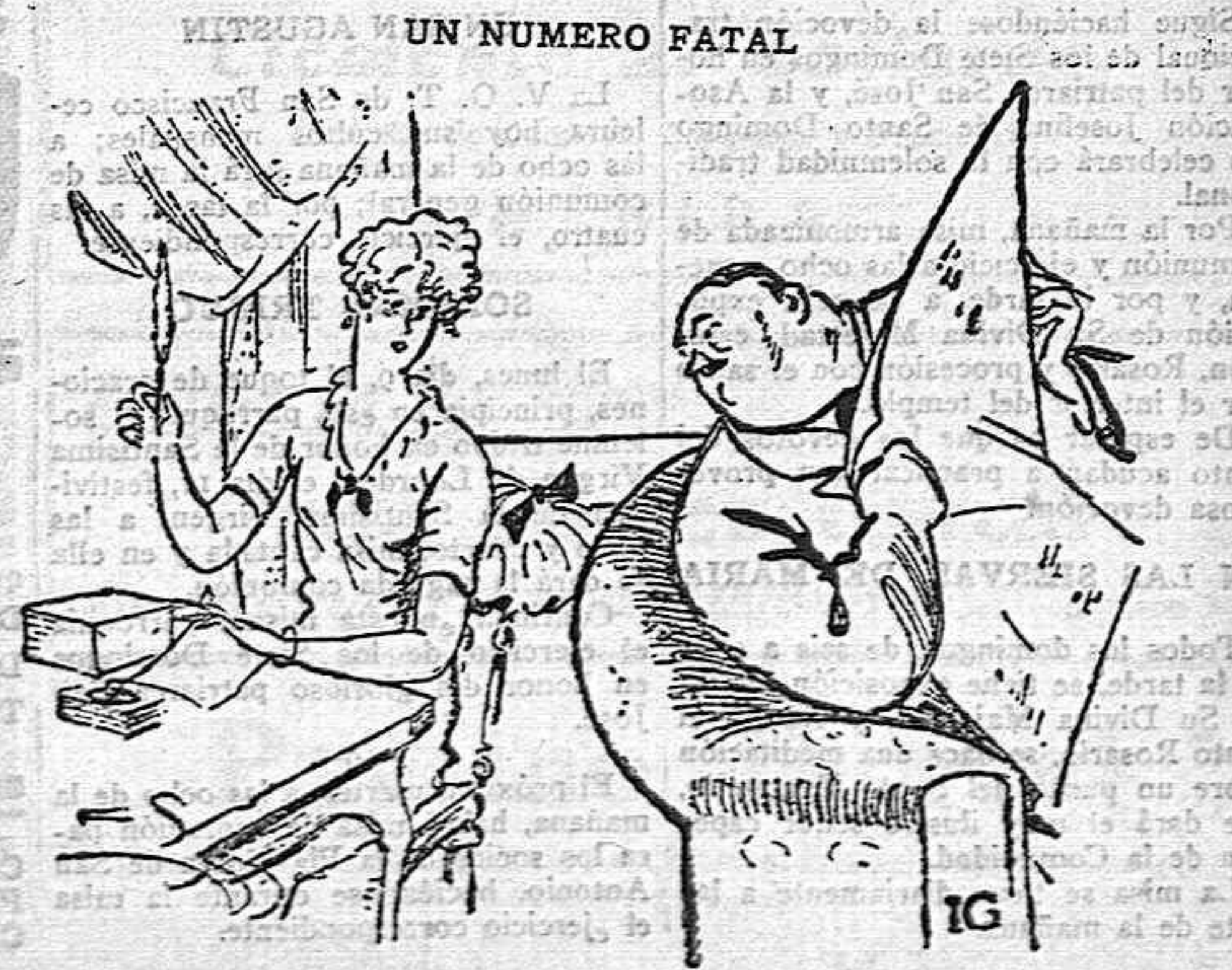
—¿Cuántas mujeres dices que has conocido? —Doce, pero olvidé el contarlas hasta después de haberme casado contigo.

Prueba Chocolates Compañía Colonial MADRID Proveedor efectivo de la Real Casa