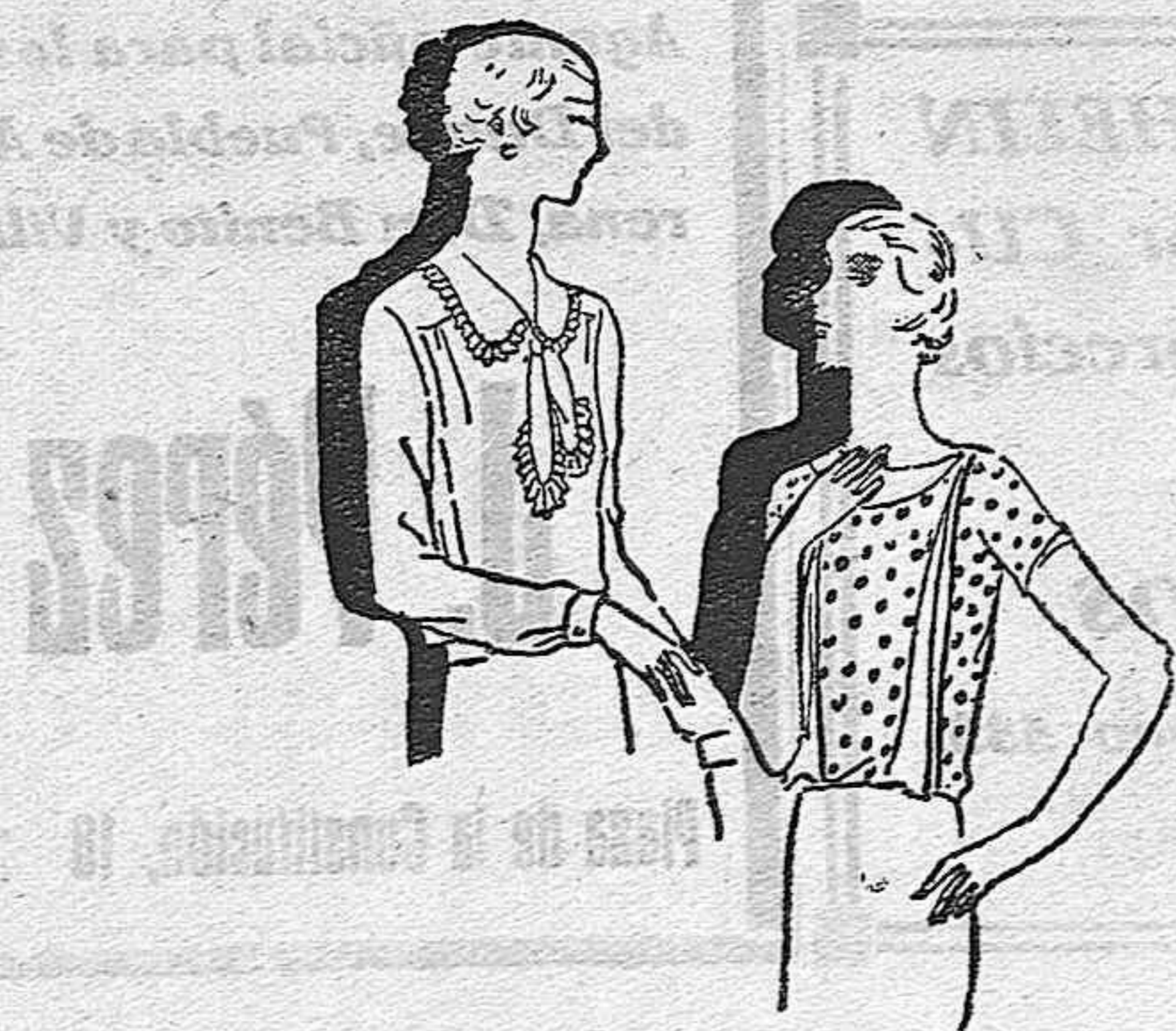
Las modernas blusas