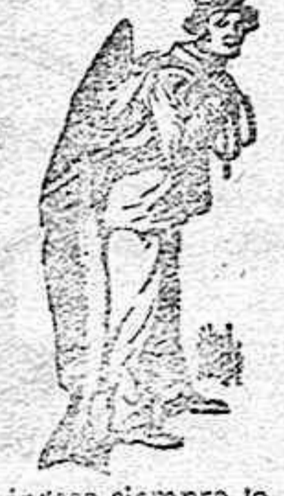
Obténase siempre la Emulsión con esta marca «El Pescador», marca del procedi- miento Scott.

en la envoltura garantiza la única emulsión que se hace del mas alto grado y de los materiales mas energicos y caros, por el procedimiento perfecto de Scott. — En todas las farmacias. — Pida muestra gratis hoy, enviando 75 cts. en sellos para el franqueo á D. Carlos Marés, Calle de Valencia 333, Barcelona.