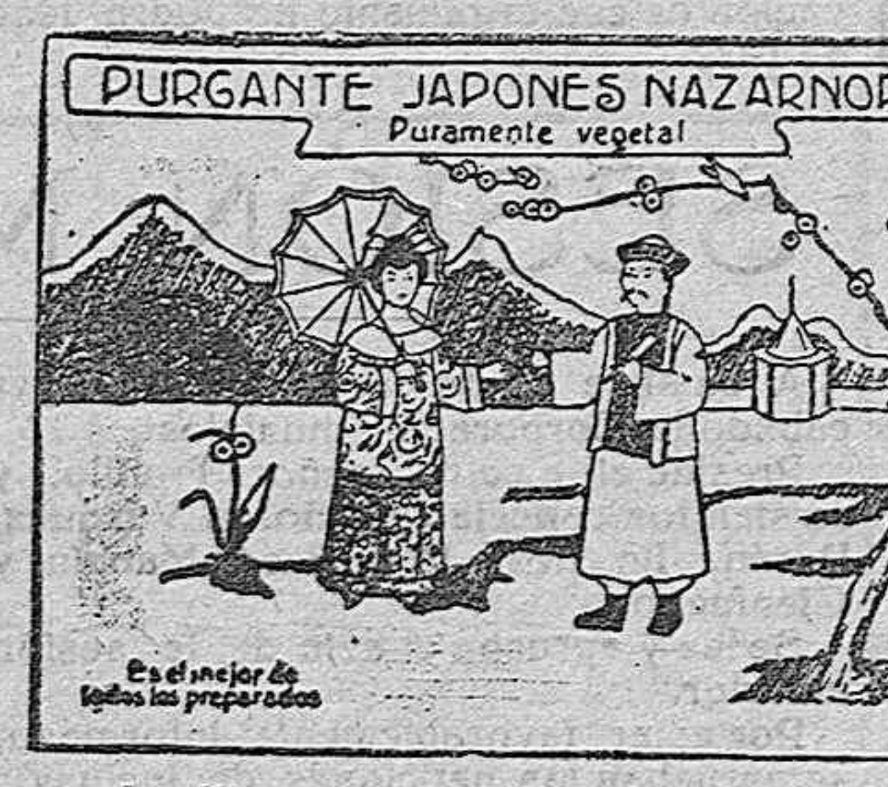
Legítimo envase del purgante japonés

SUBASTA de los aprovechamientos de hierba y bellota, hasta el próximo San Miguel, de la dehesa del «Hierro», término de Alconchel. La subasta se celebrará el día 18 del actual, a las diez de la mañana, en el local del Sindicato Agrícola de dicho pueblo, donde se encuentra de manifiesto el pliego de condiciones. SE REFORMAN capas abrigos de piel. De Gabriel, 8.