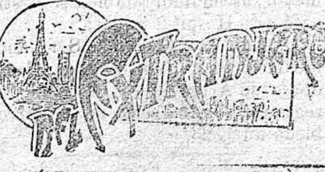
(DE NUESTRO SERVICIO ESPECIAL)

Fábrica de aserrar maderas. Construcciones-Cajonerías C. PESINI.—BADAJOZ.