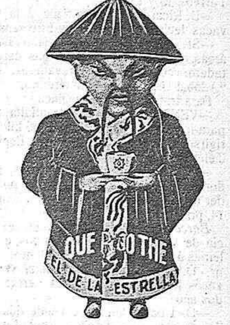
Los mejores Té, importados directamente de CHINA, INDIA y CEYLAN son los de la marca «LA ESTRELLA».