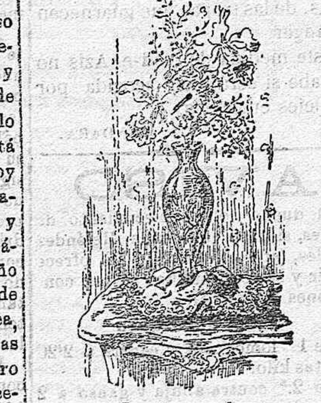
Jarrón con flores

El tono, el cachet , el estilo pecu- liar que contribuye á marcar en ella un signo de distinción característi- co, personal, por decirlo así, de quien habita aquella casa, estriba en cier- tos detalles, en algo que mejor se comprende que se expresa y que res- ponde directa y exclusivamente al gusto del dueño; mejor dicho, de la señora de la casa, puesto que gene- ralmente ella es quien en estos deta- lles, que constituyen la notita deli- cada y elegante que se destaca en un gabinete, la que coloca y escoje los adornos revelando con ello su ex- quisito buen gusto.