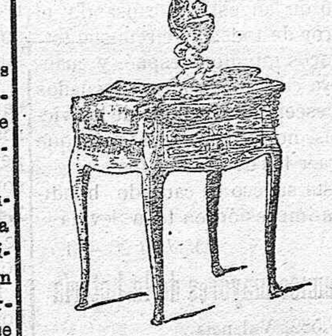
La mesa favorita

Sobre una de ellas, deposita siem- pre sus objetos preferidos y usua- les, su libro, su flor, su cestita ó bol- sa de bombones, de la que deicada- mente ofrece su sabroso contenido á los visitantes, su impertinente, su tarjetero, su memorandum , esas mil cositas que tantas veces le sirven de excelente pretexto para lucir sus gracias y sus movimientos.