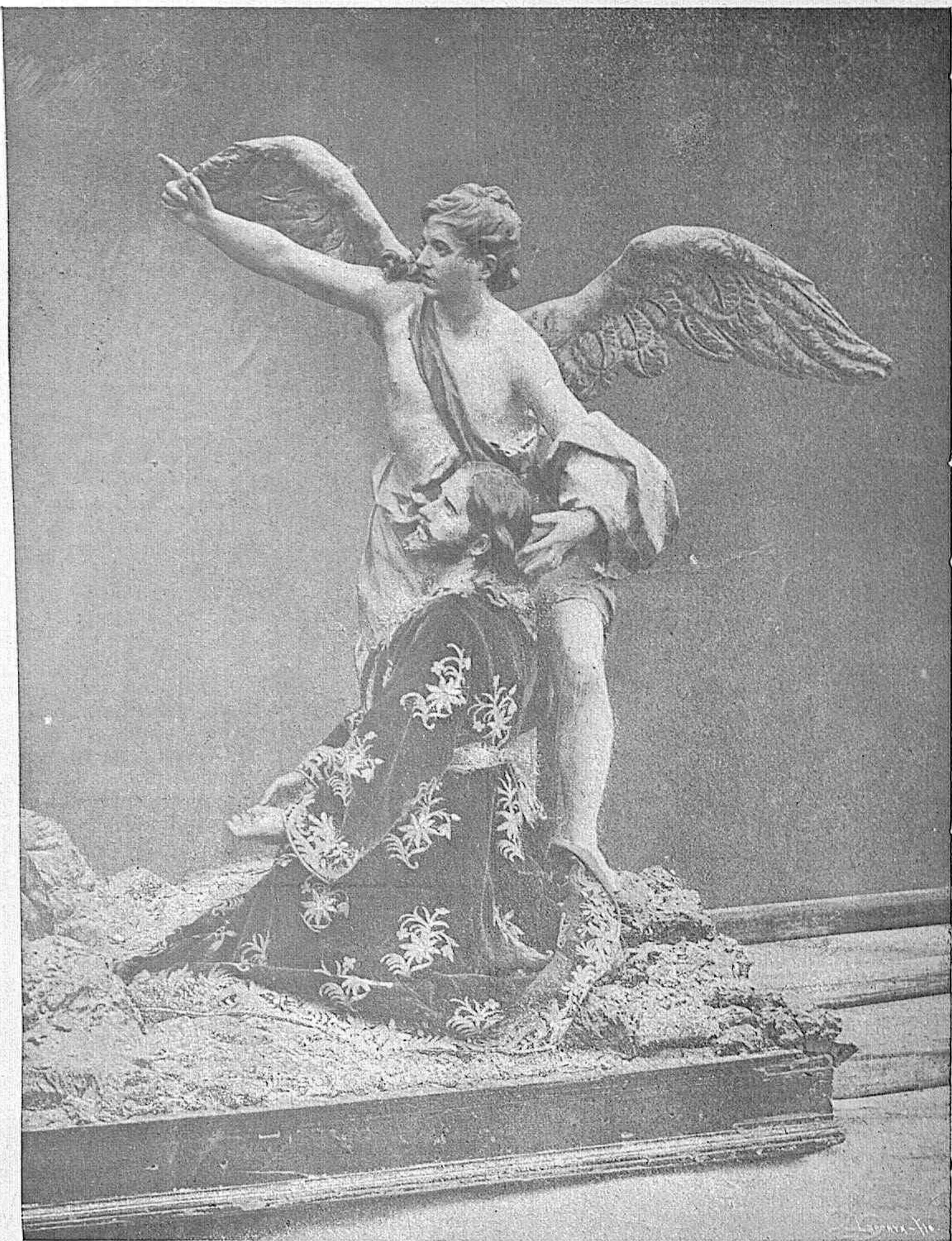
La Oración en el Huerto, obra de Salcillo.

jumbrosa, prolongada que hace estremecer los nervios con fugaces escalofríos; y á las impresiones de la calle, donde la primavera anochece, suceden las impresiones de la iglesia, donde entre chisporroteos estallantes, refulge la urna de plata que se alza en el centro del monumento envuelta en el humo de los pebeteros que embalsaman el aire, el aire cargado de rezos y oraciones, de silabas de salmos, de ardientes suspiros, que brota-