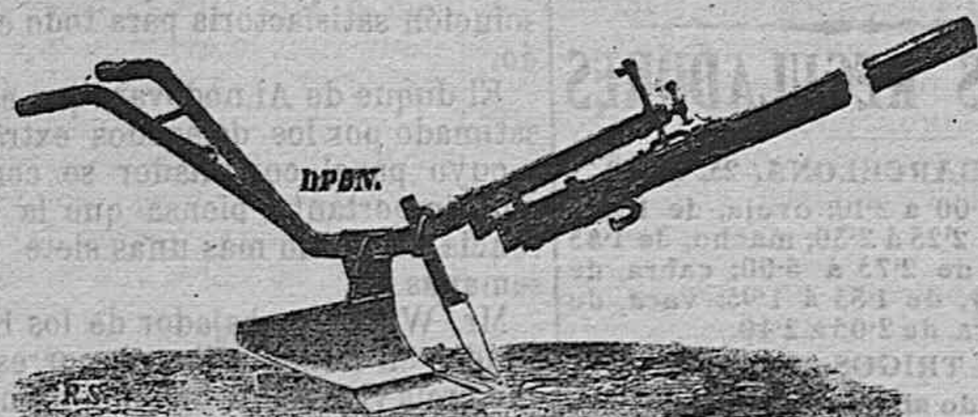
El aparato más ligero y práctico, muy útil para terrenos duros y de alguna piedra.