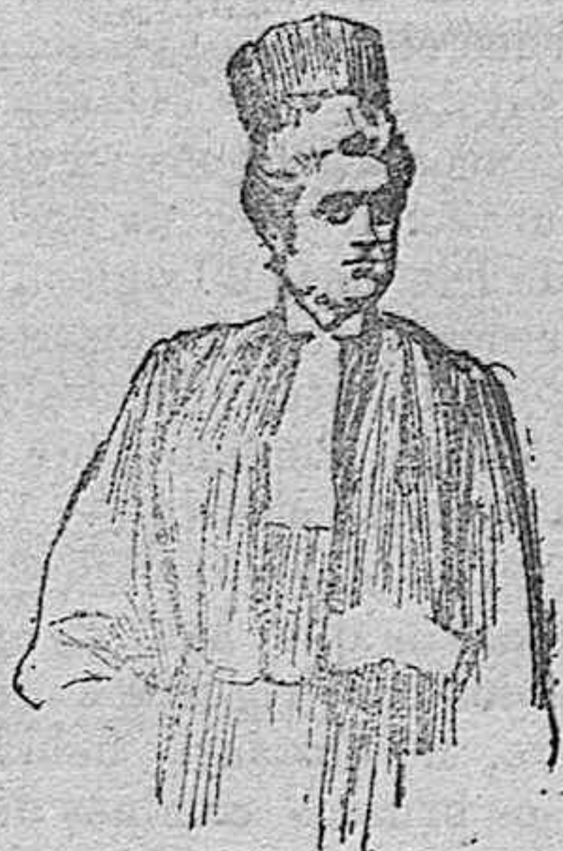
UNA MUJER ABOGADO

do, a 45; andaluz superior, nuevo, a 40; id., para fábrica, 38; maní del país, a 42; Mozambique, a 85; manchego superior, a 42; id. mediano, a 40.