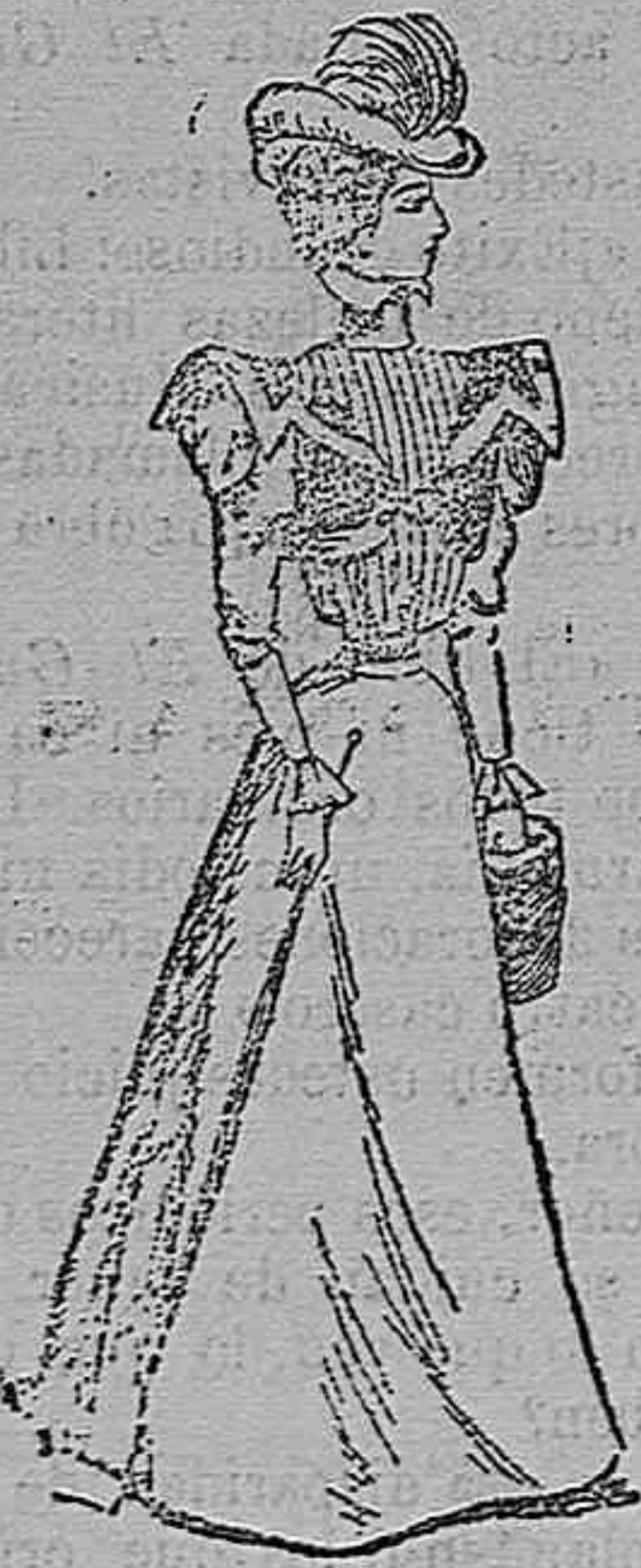
Traje para paseo.

Modelos exclusivos para nuestras lectoras, de los grandes almacenes de EL SIGLO, Barcelona (1).