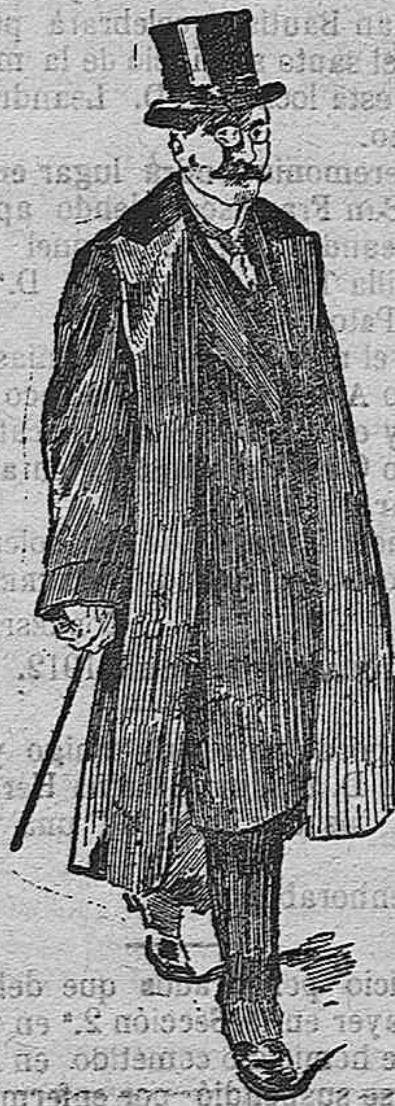
Dr. Augusto de Vasconcellos, expresidente del Gobierno portugués y actual ministro de Negocios Extranjeros.