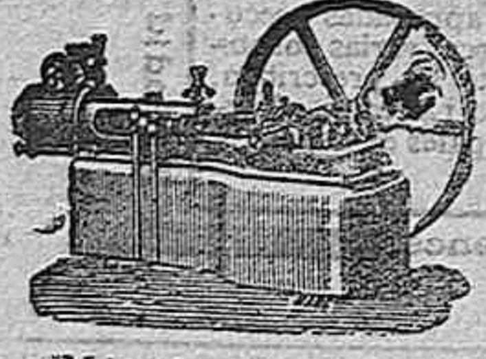
Máquina de vapor horizontal.

DESPACHO: Alcalá, 52. DEPÓSITO: Claudio Coello, 53 SUCURSAL: Campo Grande, Letra E. Valladolid. Madrid.