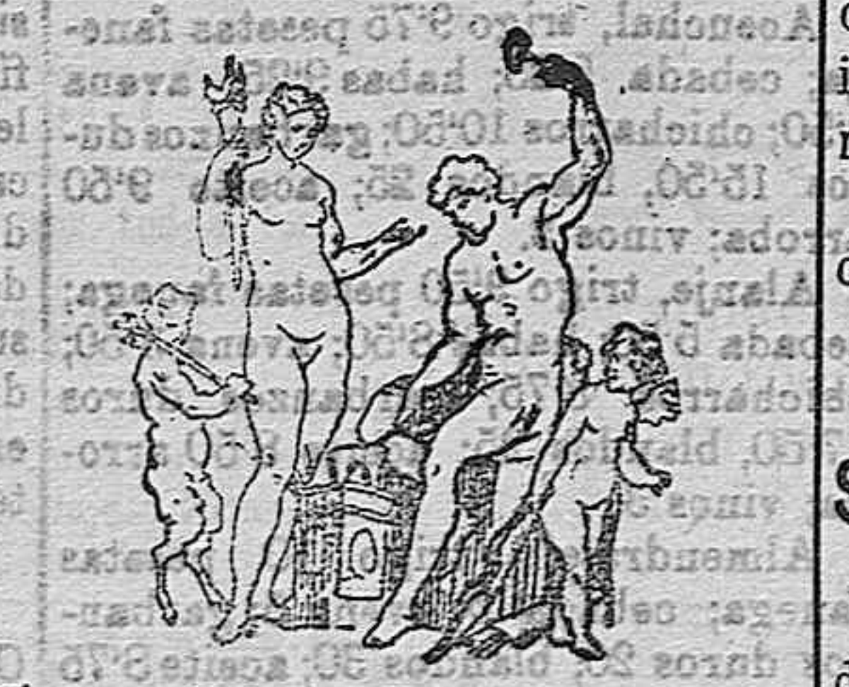
Venus y Vulcano (De una piedra grabada antigua)

Vulcano tenía, en el cielo un palacio de bronce, tachonado de infinitas estrellas, que construyó por su mano. Homero, al describir la visita que a Vulcano hizo Tetis para suplicarle forjase las famosas armas de Aquiles, dice que, en efecto, fueron una de las más acabadas obras de los dios de los herreros.