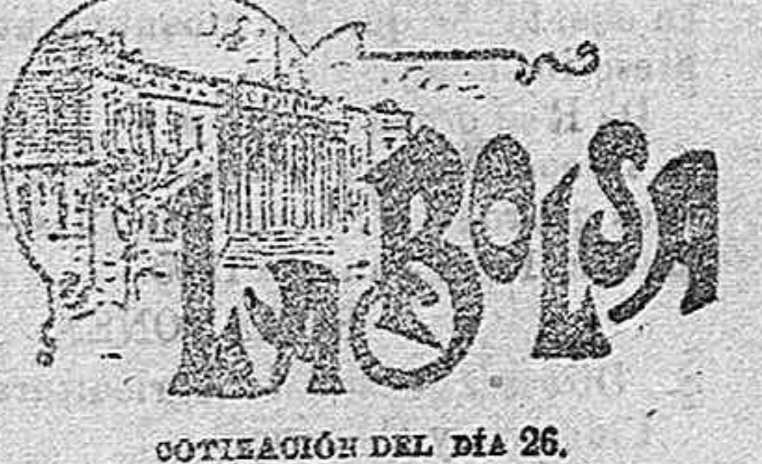
COTIZACIÓN DEL DÍA 26.