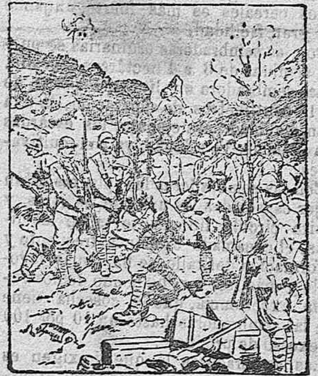
Los últimos honores rendidos a un valiente