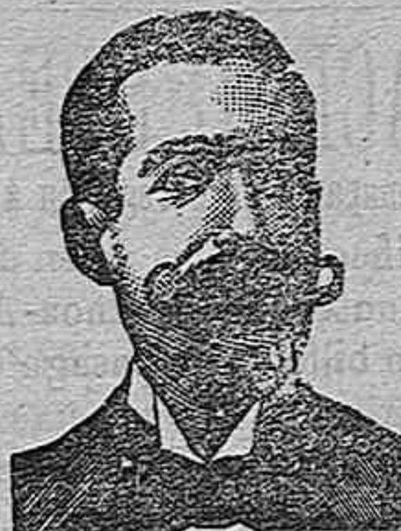
A. Salvati Costanzi

Miles y miles de celebridades médicas, después de una larga experiencia se han convencido y certificado, que para curar radicalmente los estreñimientos uretrales (estrechez), flujo blanco de las mujeres, arenillas, catarros de la vejiga, cálculos, retenciones de la orina, escozores uretrales, purgación reciente ó crónica, gota militar y demás infecciones genito-uritarias, no hay medicamento más milagroso que los Confités ó inyección Costanzi. También certifican que Diputación 485, Barc. para curar cualquier enfermedad sifilítica, en vista de que el Iodo y el Mercurio son dañinos para la salud, nada mejor que el Roob de Costanzi, pues no sólo cura radicalmente la sifilis, sino que estriba los malos efectos que producen estas substancias. El inventor A. Salvati Costanzi, calle Diputación, 453, Barcelona, seguro del buen éxito de estos específicos mediante el trato especial con él, admite á los incrédulos el pago una vez curados. Precio de la inyección, pesetas, 4. Confités antivenéreos para quienes no quieran usar inyecciones, ptas. 5. Roob antisifilítico, ptas. 4. Para provincias añadir ptas 1'00. Dichos medicamentos están de venta en todas las buenas farmacias y van acompañadas de la instrucción, en Badajoz se venden en las farmacias de D. Valeriano Casado, Plaza de San Andrés, 24 y de D. Jesús de Miguel, calle Santo Domingo 39.