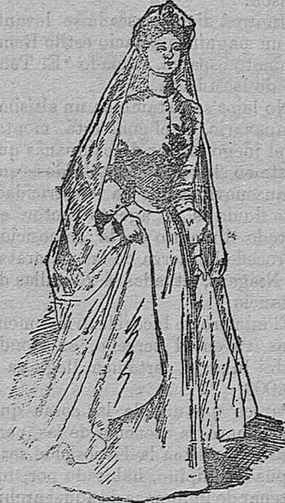
Traje para desposada.

El du de este figurín lo constituyen el cuello y las mangas. El dibujo nos ahorra dar explicaciones. Traje de piel de seda blanca ó, la mayor novedad y más costosa, de color blanco azulado ó rosado, telas muy difíciles de hallar.