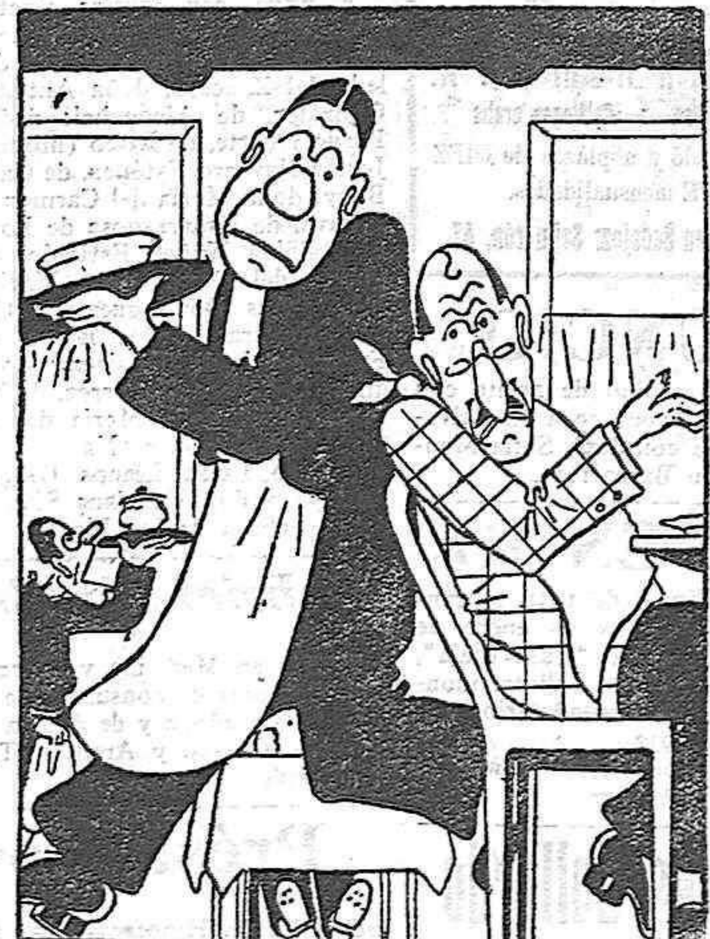
—Camarero, hace una hora que le he pedido a usted medio pato. —Sí, señor. Pero hasta que no ven ga un cliente pidiendo el otro medio, no le mato.