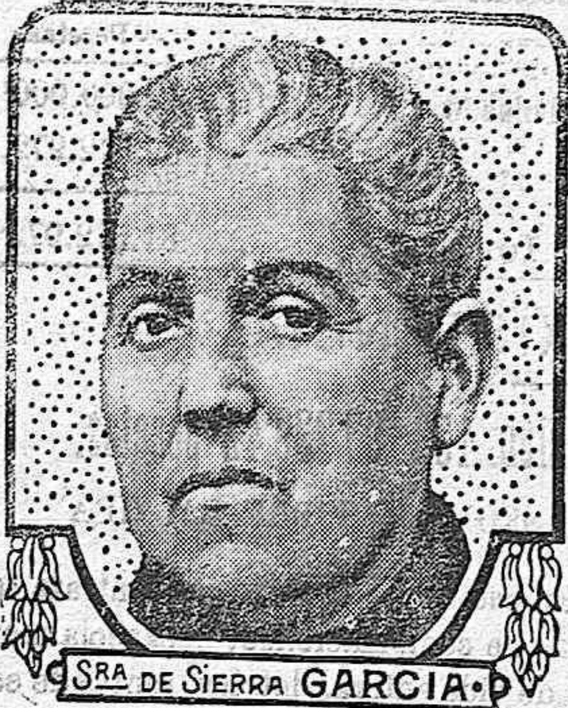
DOÑA DE SIERRA GARCÍA

Las personas entradas en años hacen mal en suponer que las indisposiciones de que adolecen con frecuencia son el inevitable resultado de la edad. Preciso es que no se imaginen tal cosa. Las personas de edad deben cuidarse lo mismo que los jóvenes: y si se cuidan por medio de las Píldoras Pink tienen grandísimas probabilidades de recuperar la integridad de sus fuerzas y de disfrutar por largo tiempo de una vejez muy resistente y todavía robusta. Mantener la sangre en estado de pureza y de fortaleza: en esto estriba el secreto de la buena salud en todas las edades de la vida.