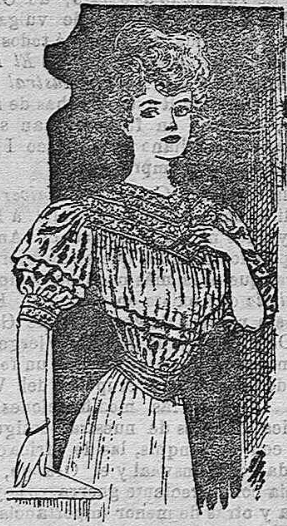
Cuerpo-blusa plegada, para señoritas; se hace en velo, adornada de bordado abierto, crespón de la China y encajes madrileños.

Las blusas plegadas con adornos de encaje madrileño, son hoy de gran novedad para señoritas y este modelo da gran resultado.