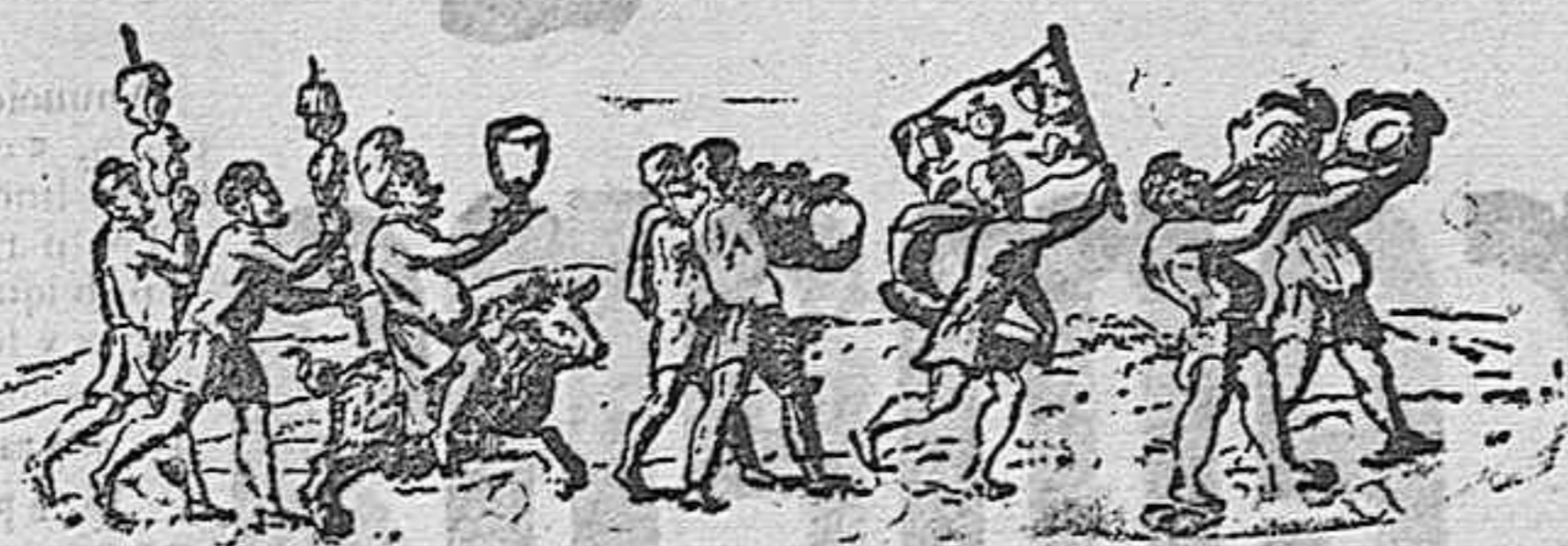
Corte del rey Panigón, rey de Corgna.

Todo en Jauja es gozo y alegría. Pero ¡ay! hay un delito que es muy castigado; el delito de trabajar. El que trabaja es encerrado en la cárcel. El señor, Panigón, rey de aquella comarca, se muestra inflexible con los trabajadores.