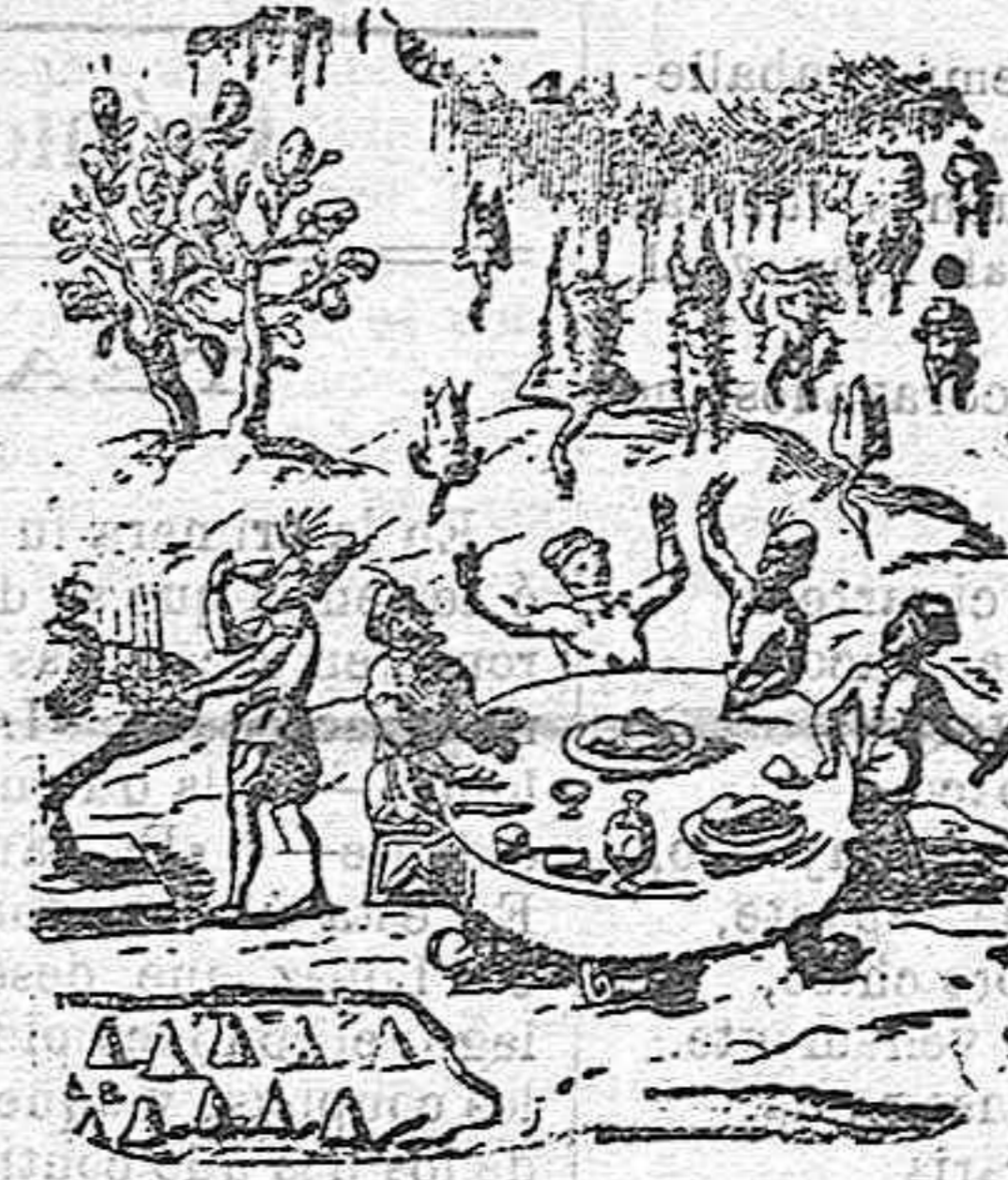
Árboles de buñuelos.—Fuente de vino.—Lluvia de asados.—Pedruscos de arizar.

¿Qué documento más digno de fe que un mapa? En él todo es preciso, y nada imaginario. El narrador puede mentir a su antojo; el calcógrafo es esclavo de la realidad. Petrus Nobilis en sus dibujos, presenta la vida pública y privada de los habitantes de Jauja, da idea de la forma de sus casas, costumbres, muebles, trajes, etc. etc.