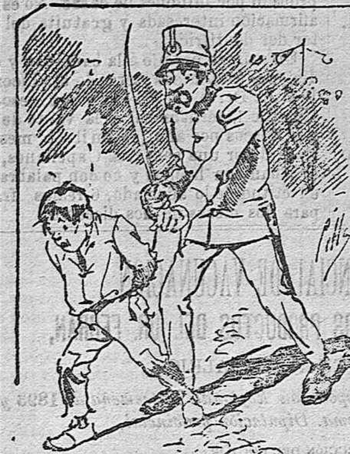
Tratamiento de la policía á nue tres vendedores cuando el número pica.....