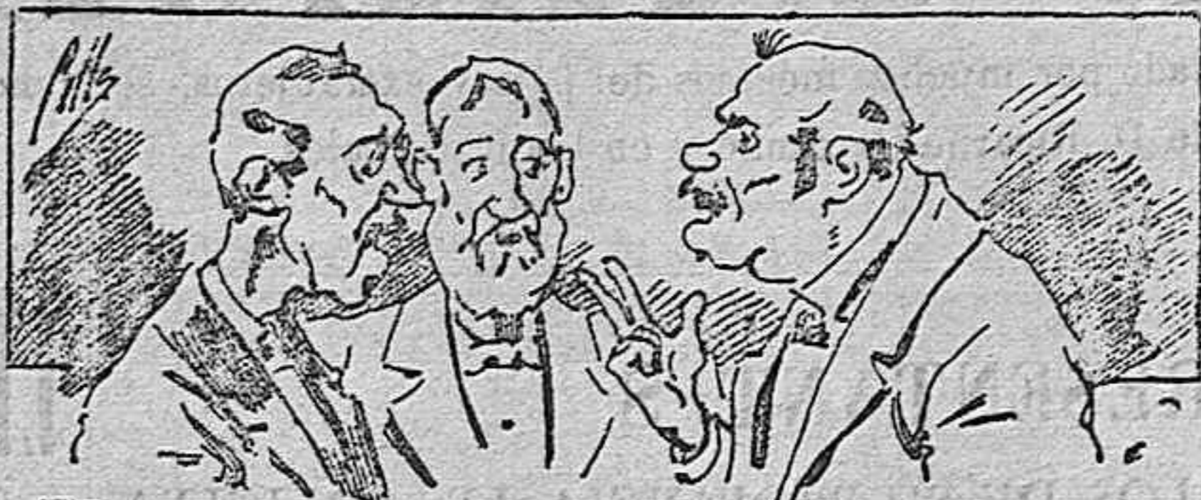
Abominan á nuestros libros....., pero los compran.

Todas las personas de gusto, curiosas é ilustradas deben pedir al Director de LA AVISPA, apar. núm. 8, MADRID, un ejemplar que se remite gratis y franqueado. Esta Revista Enciclopédica Popular publica recreaciones científicas, recetas de cocina, repostería, confitería, vinos, licores, pinturas, barnices, betunes y fórmulas para toda clase de industria, y cuantas noticias y conocimientos puedan ser beneficiosos. Cuenta además con buenos grabados, parte literaria excelente; da regalos mensuales á sus lectores con la Lotería Nacional y participaciones en la misma, á cuyo efecto compra todos los sorteos, y en una de las Administraciones más afortunadas por la suerte, billetes enteros. La suscripción y los números que se nos pidan se sirven gratuitamente á correo vuelto y franqueados, con sólo indicar el nombre y dirección del que lo desea en sobre dirigido al Sr. Administrador de