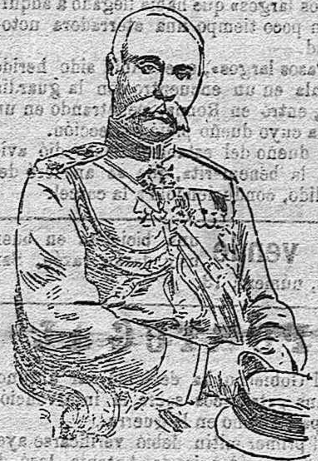
General Letchitsky que manda el grupo de ejércitos de la izquierda del general Brusiloff que opera desde el Stripa a la frontera rumana, y que últimamente se ha apoderado de Stanislaw...