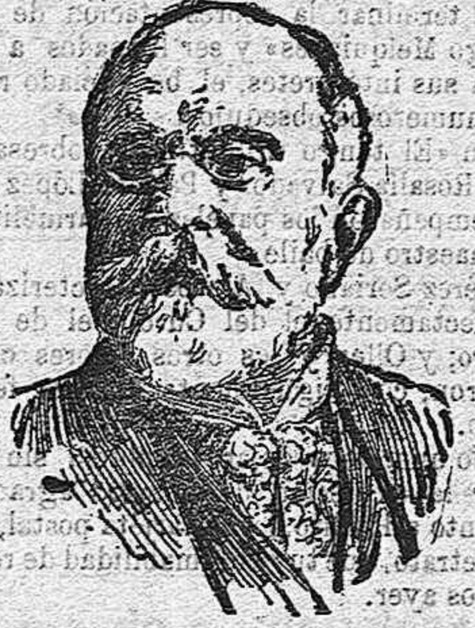
El señor marqués del Muni, nuevo embajador de España en París