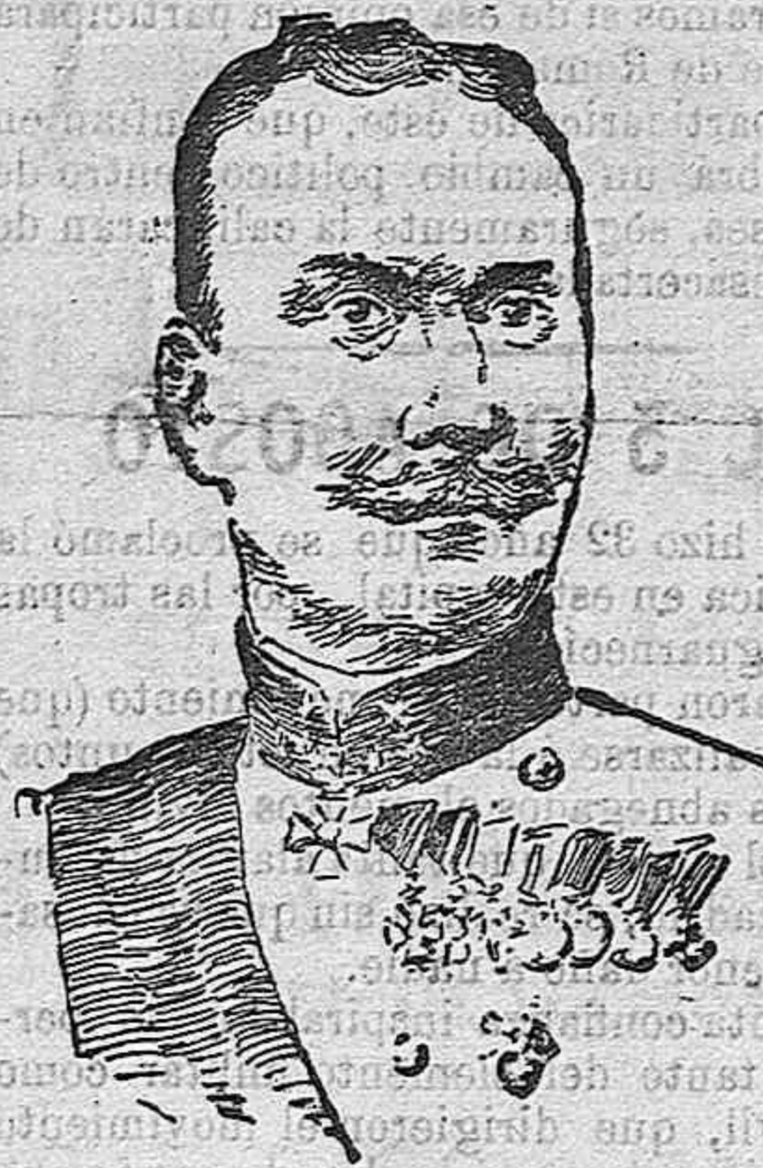
General barón von Ozibulka, comandante de uno de los cuerpos de ejército húngaros que opera en la Galitzia oriental.