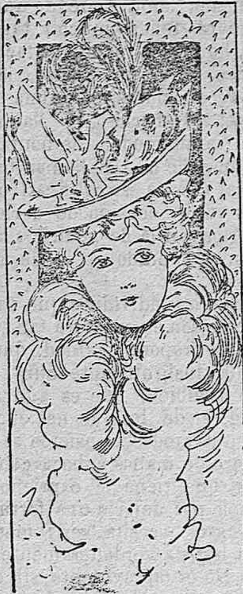
Sombrero para señorita

Modelos exclusivos para nuestras lectoras, de los grandes almacenes de EL SIGLO, Barcelona.