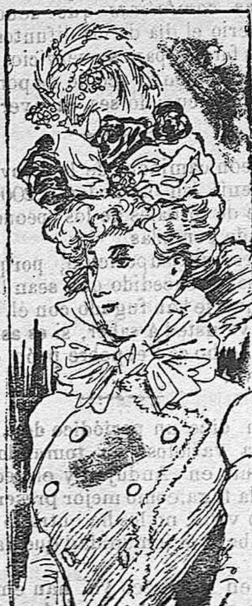
Sombrero para señorita

Modelos exclusivos para nuestras lectoras, de los grandes almacenes de EL SIGLO, Barcelona.