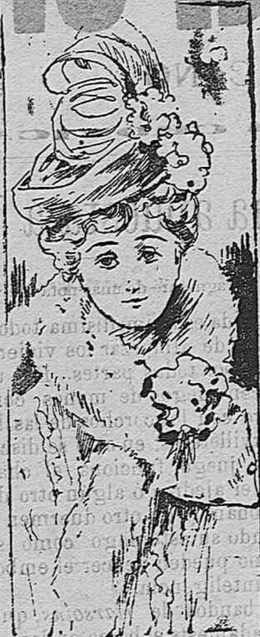
Sombrero fin de siglo.

Como se ve en el dibujo, esta prenda resulta elegantísima si á la colocación de los adornos preside un refinado gusto, siempre que este no quisiera ajustarse á nuestro modelo.