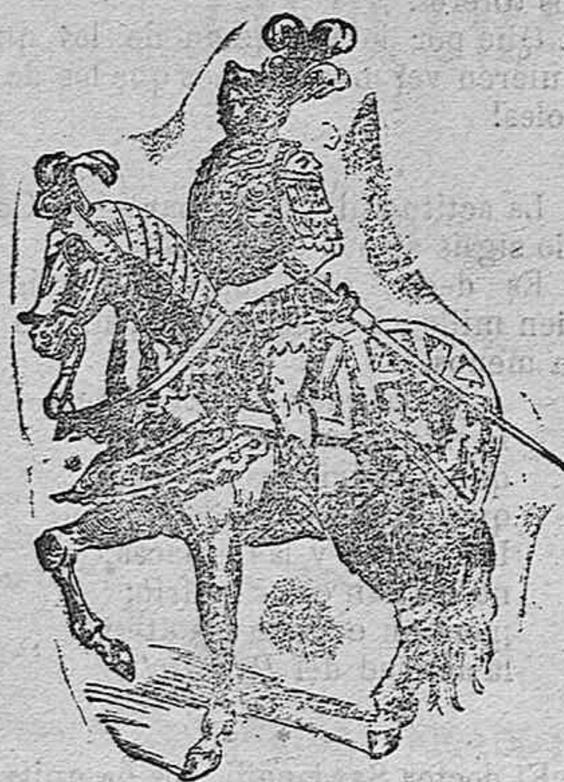
Armadura de Carlos V á su entrada en Túnez.

Consérvanse en la Armería Real tres armaduras del emperador Carlo V, las tres de relevante mérito. La que presentamos en el dibujo correspondiente á esta descripción es la que usó á su entrada en Túnez, unida á la de su caballo. Están ambas montadas sobre maniqués y su valor artístico es grande.