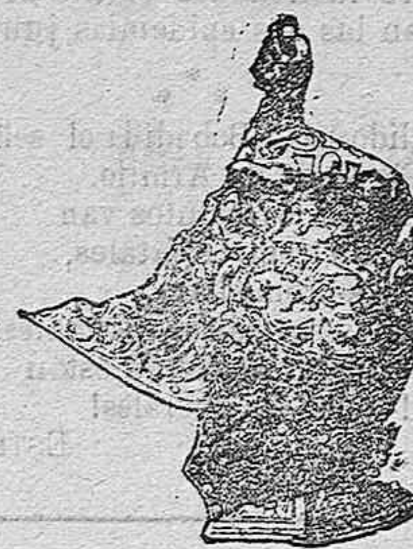
Yelmo del duque de Alba.

Consérvanse en la Armería Real tres armaduras del emperador Carlo V, las tres de relevante mérito. La que presentamos en el dibujo correspondiente á esta descripción es la que usó á su entrada en Túnez, unida á la de su caballo. Están ambas montadas sobre maniqués y su valor artístico es grande.