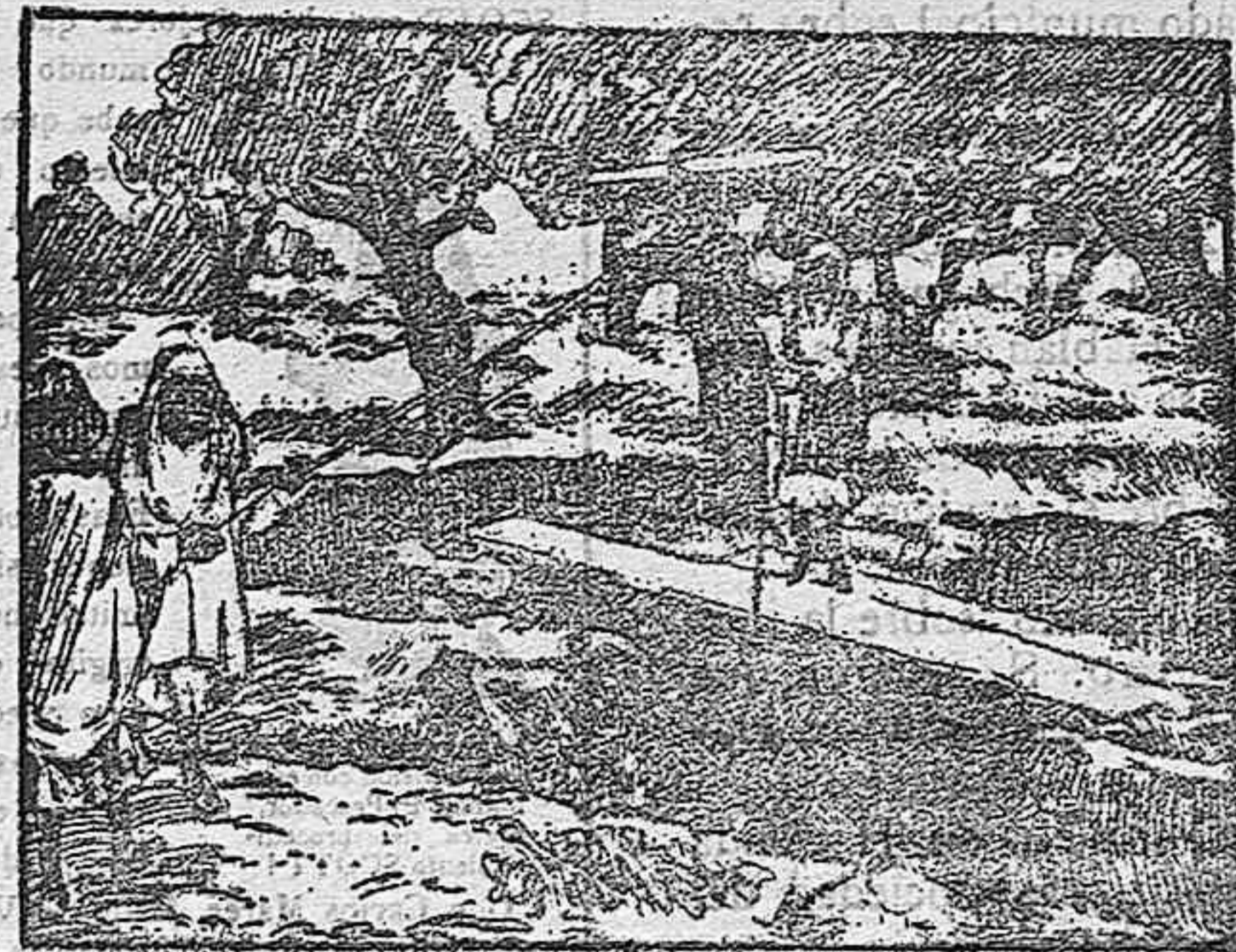
(Extrayendo osamentas humanas de la cisterna.)

lluvias, conduciéndolas a una gran cisterna que se ha empezado a desescombrar. Esta cisterna que tiene de ancho 2 metros cuadrados y 28 de profundidad, se haya repleta de esqueletos humanos, habiéndose contado hasta el número de 1.500 de ellos. Supónese que estos restos sean el resultado de algún degüello que habría tenido lugar cuando la toma de Cartago por los vándalos, cuyas bandadas armadas asolaron el país arrasando las ciudades, destruyendo los monumentos y tafiando los campos.