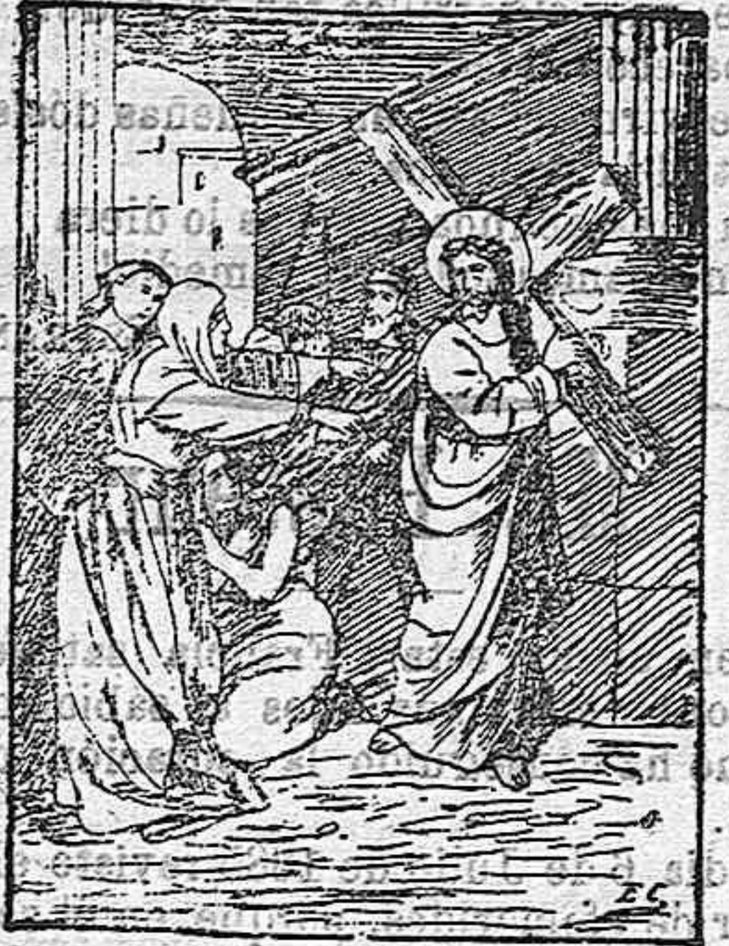
Jesús encuentra a su madre