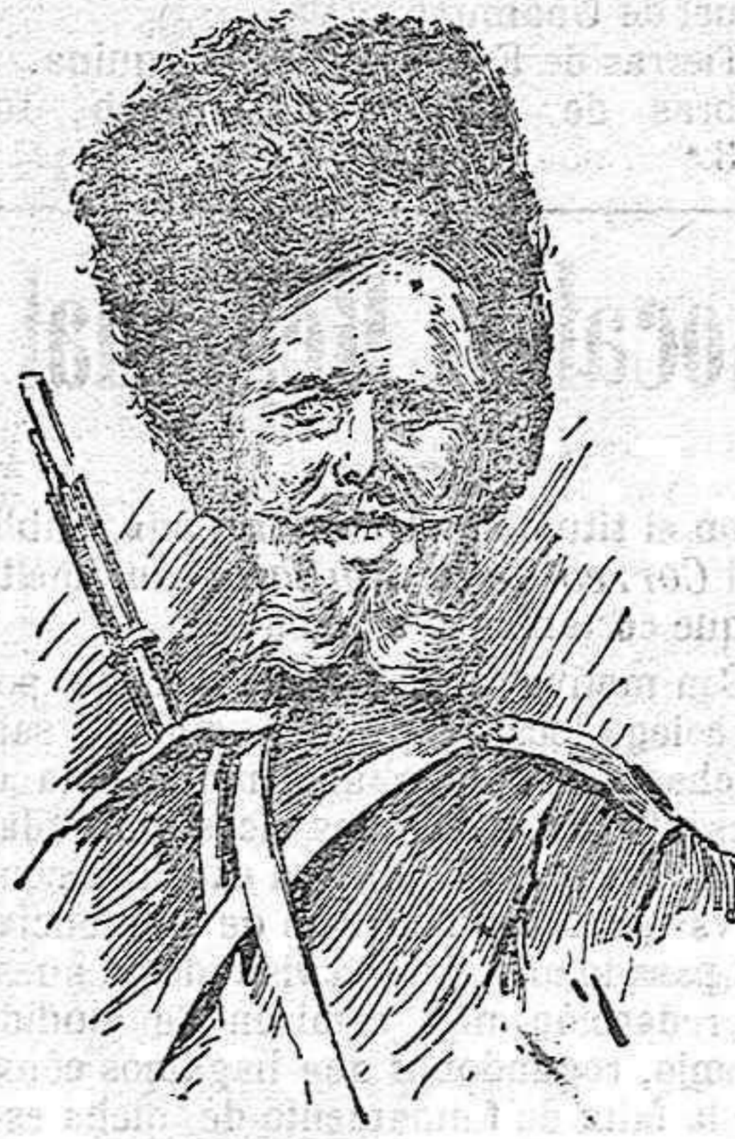
Tipo característico del cosaco del Dow