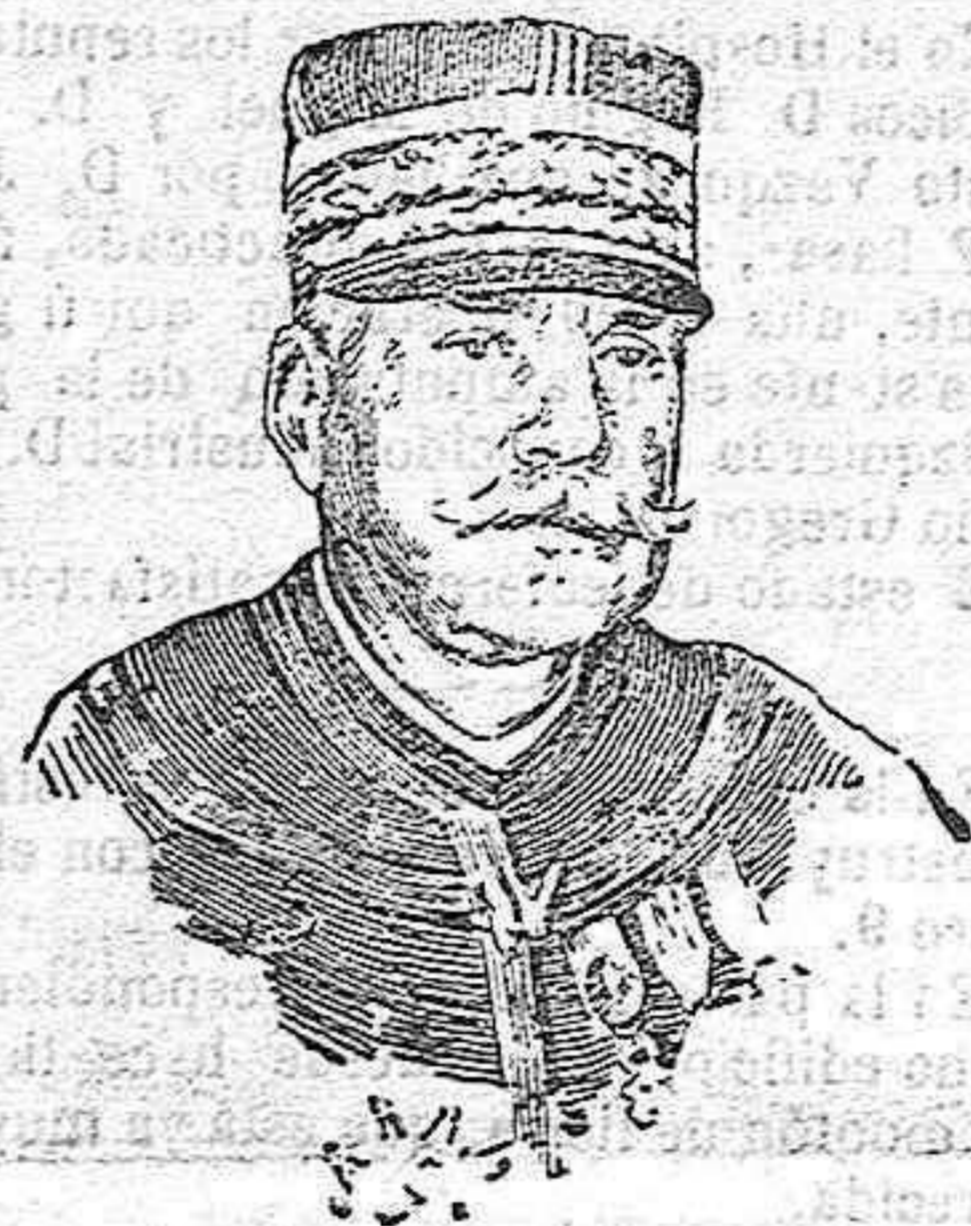
General Joffre, generalísimo del ejército francés