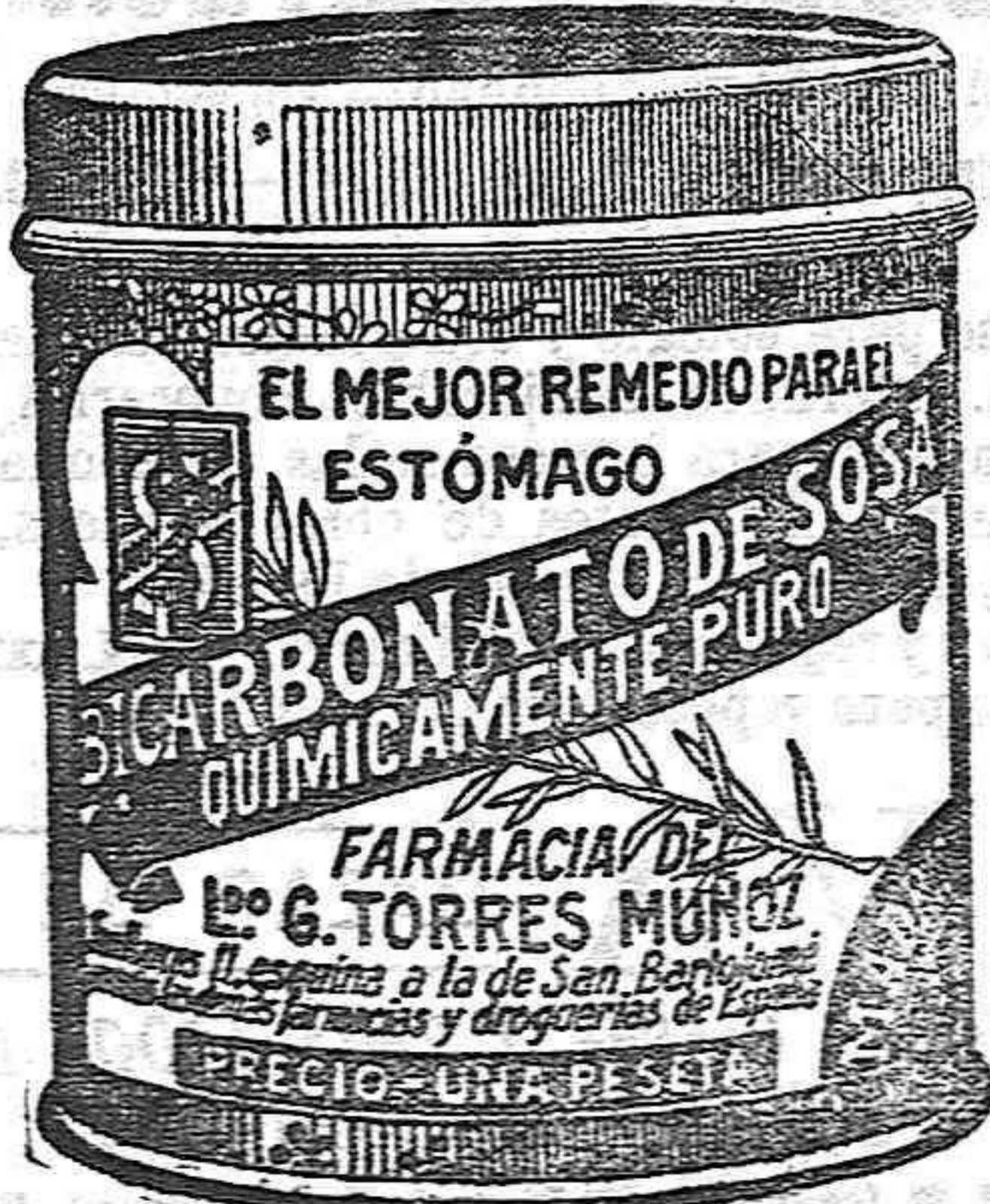
Cuidado con las imitaciones que son perjudiciales