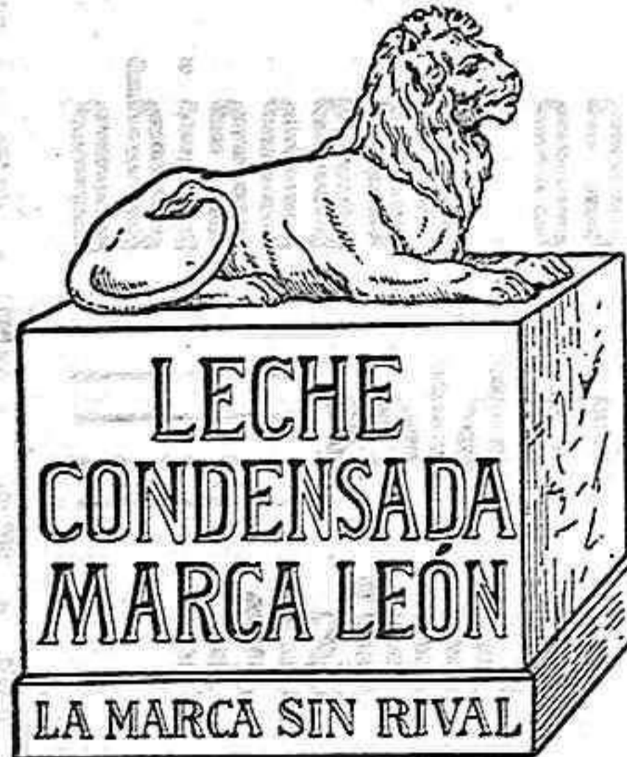
Natura-Milch-Exportgesellschaft Bosh & Co. m. b. H. Waren in Mecklenburg.