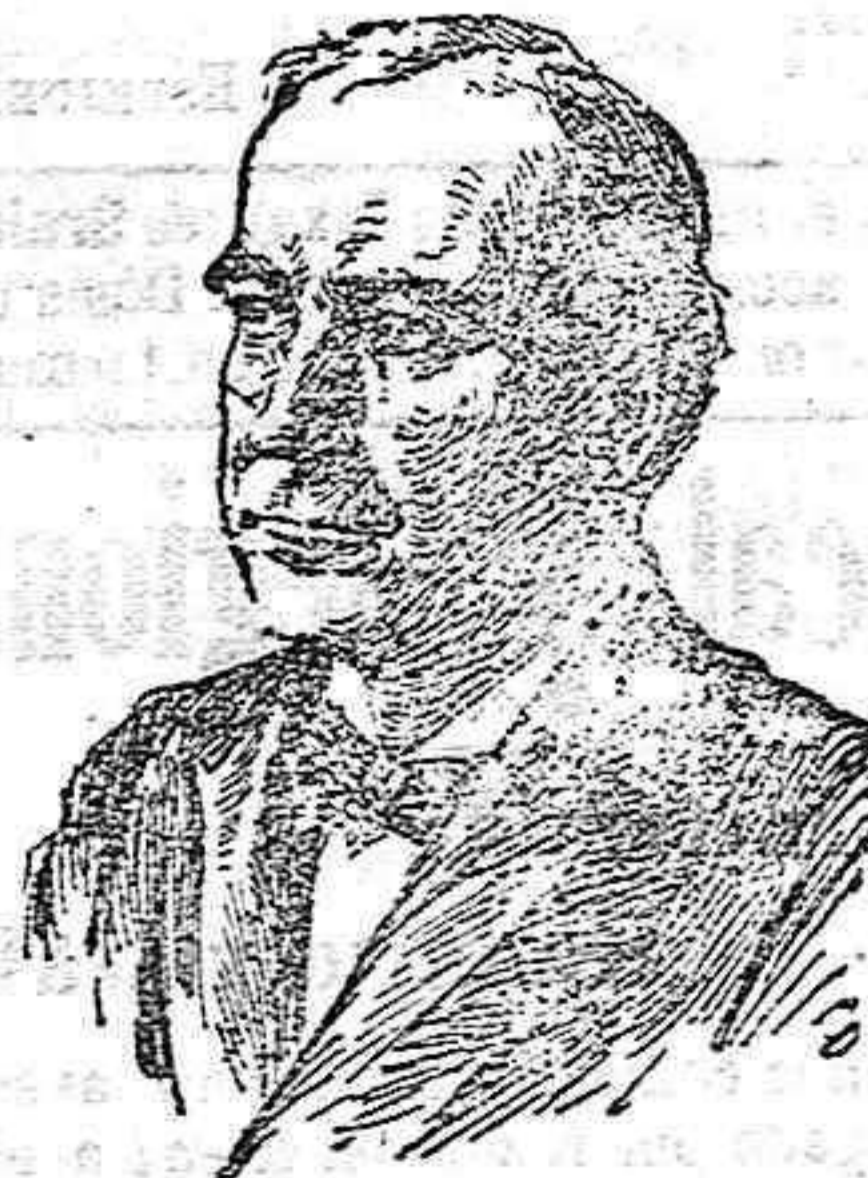
Mister Bryan, ministro del exterior de los Estados Unidos

El cable nos presenta á los norte-americanos dispuestos á ir donde sea preciso, á cuyo fin acumulan toda clase de elementos de combate, y al presidente Huerta satisfecho y hasta contento de la resolución del legendario enemigo del Norte. (1)